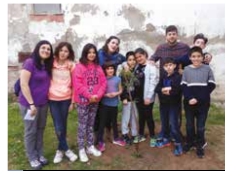
Responsables del Cau Jove i grup de nois i noies que van plantar l'arbre

Des del Cau Jove també s'està treballant en el projecte de dissenyar un espai Chill Out, que es fa els dimecres i els divendres a la tarda. Els joves que participen en aquesta iniciativa ara estan polint i pintant uns palets de color blanc, després faran el muntatge del lloc i, finalment, el decoraran amb coixins i altres elements. Pel que fa a les xerrades, el dijous 16 de febrer se'n va fer una sobre diversitat sexual, que va anar a càrrec de membres de l'associació Dones amb Empenta i a la