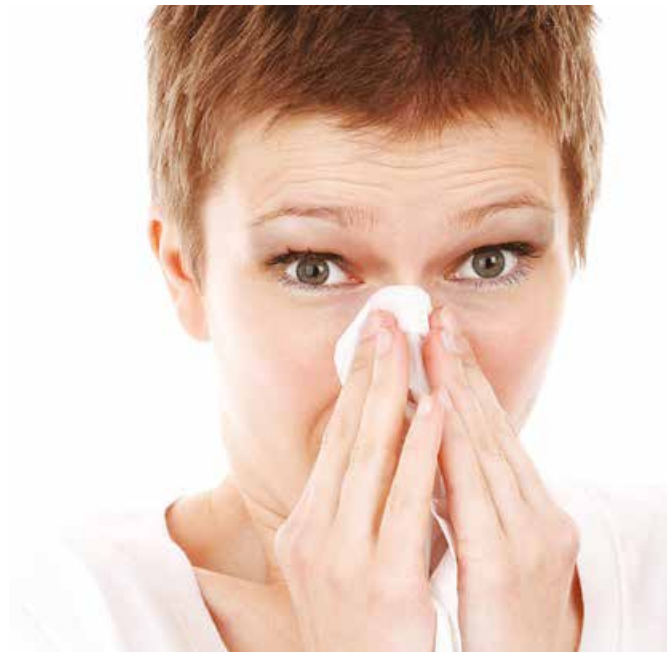
Un dels símptomes de l'al·lèrgia és l'obstrucció i la mucositat nasal

Per a moltes persones, l'arribada del bon temps és sinònim d'esternuts, ulls plorosos i picors. Els experts preveuen que aquesta primavera serà força complicada per als qui pateixen al·lèrgies respiratòries. I és que la tardor ha estat més càlida de l'habitual i l'hivern ha tingut alguns episodis calorosos. En conseqüència, algunes plantes estan produint molta més quantitat de pol·len, sobretot, els plataners, les gramínies, les oliveres i els xiprers.