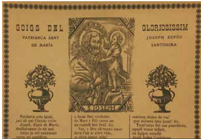
Capçalera d'uns goigs impresos a Barcelona a final del segle XIX

A la segona meitat del segle XIX, a la Pobla de Claramunt es van constituir quatre germandats de socors mutus per malaltia o accident, amb les advocacions de Sant Josep, Sant Isidre, Sant Sebastià i Sant Procopi.