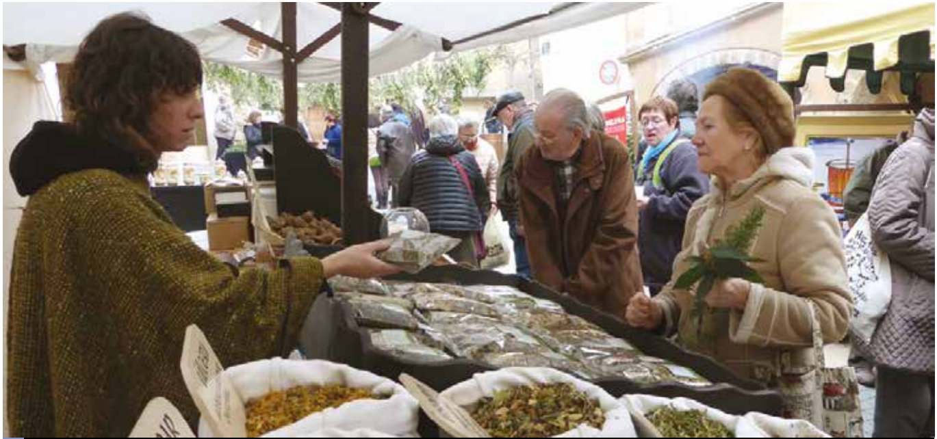
Una de les parades del mercat de productes artesanals