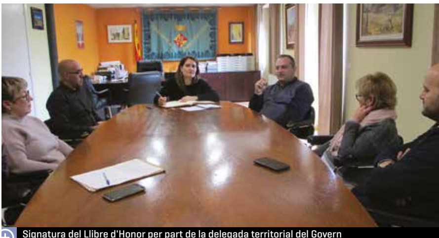
Signatura del Llibre d'Honor per part de la delegada territorial del Govern