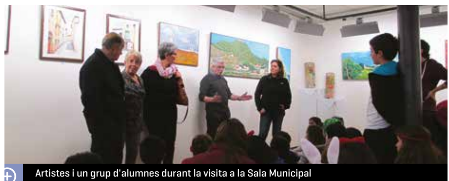
Artistes i un grup d'alumnes durant la visita a la Sala Municipal

Els alumnes de cicle mitjà i superior del col·legi Maria Borés van visitar, el dijous 23 de febrer, coincidint amb Dijous Llarder, la Sala Municipal d'Exposicions. Els nens i nenes van poder veure els quadres d'un grup de pintors i pintores locals, una mostra que es va inaugurar el 2 de febrer per la Fira de la Candelera. Alguns dels artistes que exposaven les seves obres van explicar als estudiants les diferents tècniques utilitzades, com l'oli, l'aquarel·la o les ceres. Els alumnes de tercer i quart van poder practicar algunes de les tècniques i endur-se el dibuix que havien fet a casa. Els nois i noies de cinquè i sisè van poder fer diverses preguntes als artistes, que els