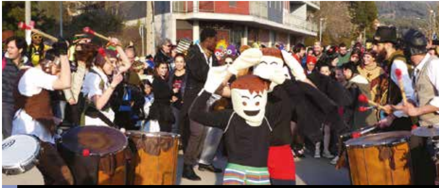
Rua amenitzada pels ritmes del grup de batukada Sound DCK