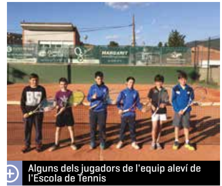
Alguns dels jugadors de l'equip aleví de l'Escola de Tennis

Pel que fa a l'Escola de Tennis, l'equip aleví masculí està jugant a la Lliga de Terrassa i se situaven en el setè lloc de la taula, amb