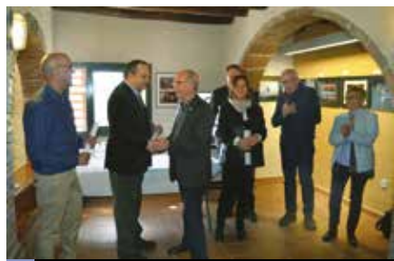
Acte de presentació de la nova entitat

La Sala Celler de la masia de can Galan va acollir, el diumenge 26 de març al migdia, la presentació pública de l'Agrupació Fotogràfica de la Pobla de Claramunt. Aquest espai és la seu de la nova entitat creada recentment al nostre municipi. A l'acte, que va comptar amb el suport de l'Ajuntament, hi van assistir una setentena de persones.