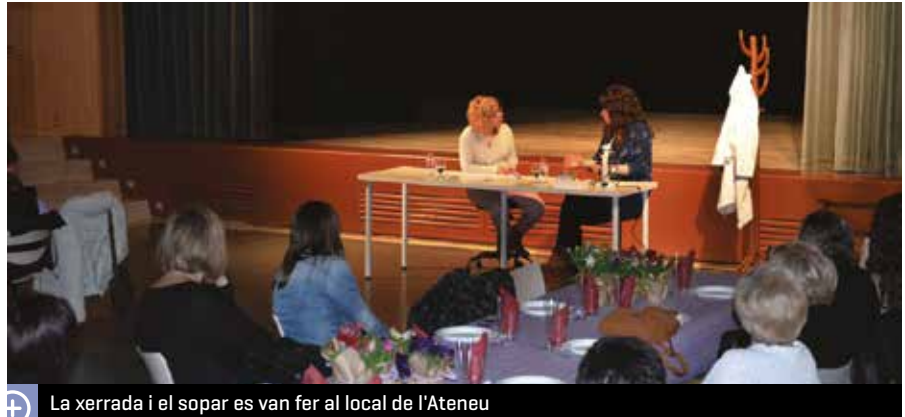
La xerrada i el sopar es van fer al local de l'Ateneu

La jove investigadora va tancar la xerrada parlant del paper de la dona en el món de la investigació. Va explicar que no hi