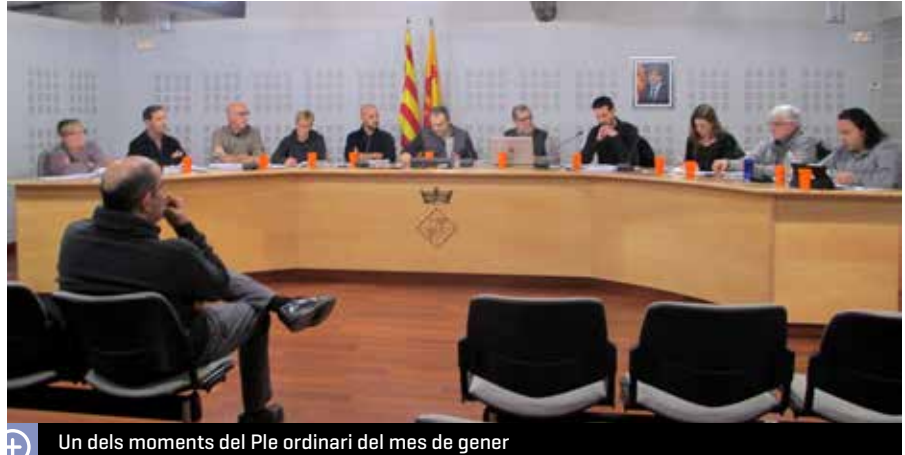
Un dels moments del Ple ordinari del mes de gener

A més d'aquest tema, en el ple de gener es va aprovar la modificació de la periodicitat de les sessions ordinàries, que es faran cada tres mesos, d'acord amb la llei vigent, el segon dimecres, no festiu,