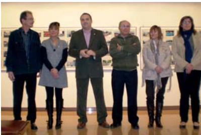
INAUGURACIÓ DE L'EXPOSICIÓ DE FOTOGRAFIES DE L'AFM

Entre els mesos de març i abril la Sala d'Exposicions va acollir dues mostres, una de punt de creu i mig punt de la capelladina