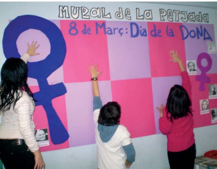
EL CAU JOVE VA ELABORAR UN MURAL PER CELEBRAR EL 8 DE MARÇ

Des del Cau Jove fem un repàs al passat, des del punt de vista de la dona, i, concretament, ens situem a final del segle XIX i començament del XX. En aquella època, el col·lectiu femení demanava un nou estatus social i començava a fer sentir la seva veu, ja que fins llavors sempre havia estat deixat de banda. Les dones no podien participar ni de la societat, ni de la cultura, ni de l'economia. Aquests eren uns àmbits reservats, exclusivament, als homes. Elles s'havien de quedar recloses a casa i, si treballaven, era en la més absoluta precarietat laboral.