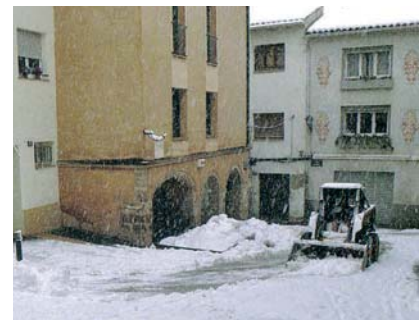
UNA MÀQUINA TRAIENT LA NEU A LA PLAÇA DE LA VILA