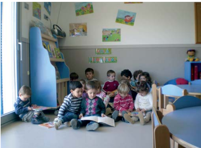
CLASSE DELS ALUMNES MÉS GRANS, DE 2 A 3 ANYS