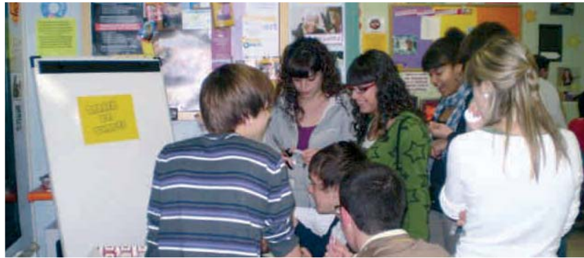
TALLER DE XAPES AL CAU JOVE

A més d'aquesta activitat, el jovent del nostre municipi podrà gaudir d'altres propostes. El divendres 7 de maig els noies i les noies podran participar en un taller de trufes i els dies 20, 21 i 22 d'aquest mateix