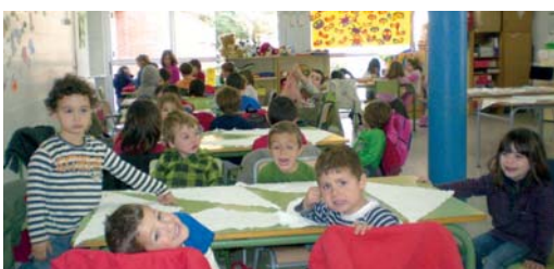
LES ACTIVITATS DEL JUGA A LA PRIMAVERA ES VAN FER A L'ESCOLA

Una seixantena de nens i nenes d'entre 3 i 12 anys va participar en una nova edició del Juga a la Primavera, que es va fer del 29 de març a l'1 d'abril. Aquesta activitat es va organitzar des de la regidoria d'Infància i Joventut.