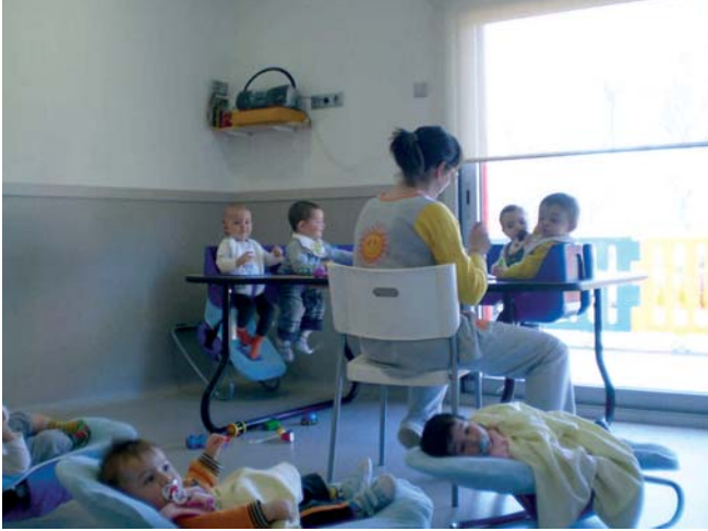
CLASSE DELS INFANTS MÉS PETITS, DE 4 MESOS A 1 ANY