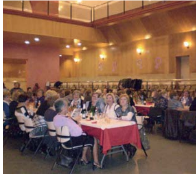
EL SOPAR ERA EL SEGON ANY QUE S'ORGANITZAVA