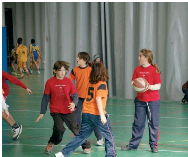
ELS NENS I LES NENES COMPETEIXEN EN DIFERENTS ESPORTS

Alumnes de l'escola Maria Borés participen, per primer any, als Jocs Escolars de l'Anoia. La participació en aquesta activitat, organitzada des del Consell Esportiu de l'Anoia, s'impulsa des de l'AMPA del centre educatiu poblatà i compta amb el suport de la regidoria d'Educació de l'Ajuntament.