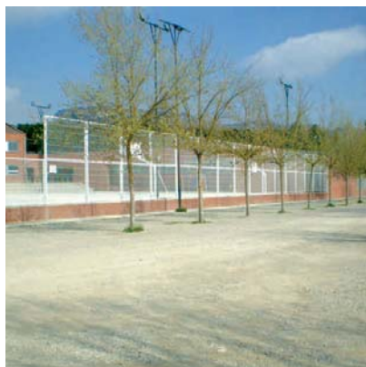
ASPECTE ACTUAL DEL FUTUR PASSEIG DE LLUÍS COMPANYYS