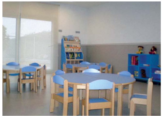
EL NOU CENTRE DISPOSA DE QUATRE AULES