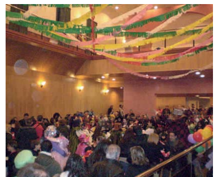
L'ATENEU ES VA OMLIR DE DISFRESSES I DE CONFETI

Es va repartir berenar i la festa es va acabar amb una discomòbil que va animar tothom a sortir a la pista. Aquesta activitat la va organitzar la regidoria de Cultura.