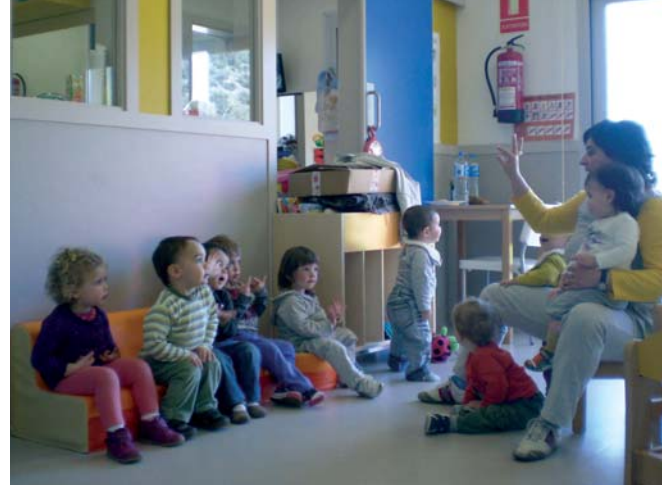
CLASSE DELS NENS I NENES D'1 A 2 ANYS