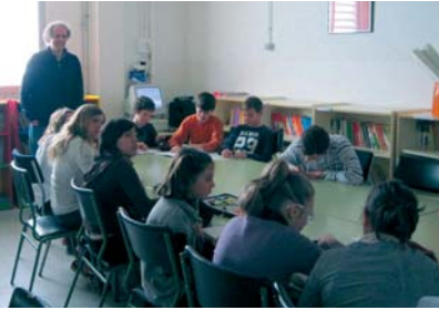
SESSIÓ INFORMATIVA A L'ESCOLA AMB L'ENGINYER MUNICIPAL

Els alumnes de sisè de l'escola Maria Borés van fer, durant la primera quinzena de febrer, un treball per aprendre a estalviar aigua. Amb el lema "L'aigua, un bé escàs", els alumnes van treballar diferents aspectes, com el consum d'aigua a casa seva o l'anàlisi dels diversos conceptes de la factura. El treball es va iniciar amb el recull de les