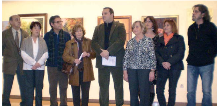
INAUGURACIÓ DE LA MOSTRA DE PINTORS I PINTORES POBLATANS

A la plaça de la Vila s'obsequiava els infants amb una espelma per encendre-la i expressar els bons desitjos per a aquest any i els més grans podien cremar els fets negatius en una foguera. Era al voltant d'aquest foc on una vella Candelera