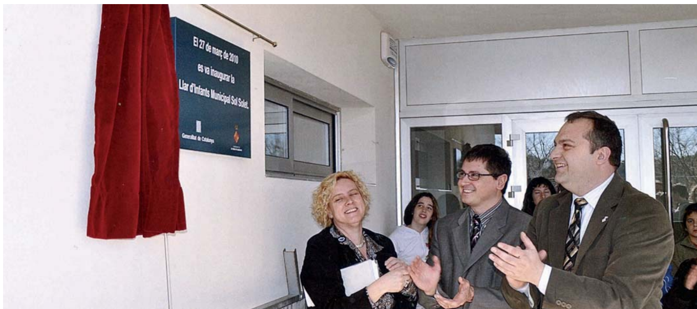
DESCOBERTA DE LA PLACA COMMEMORATIVA