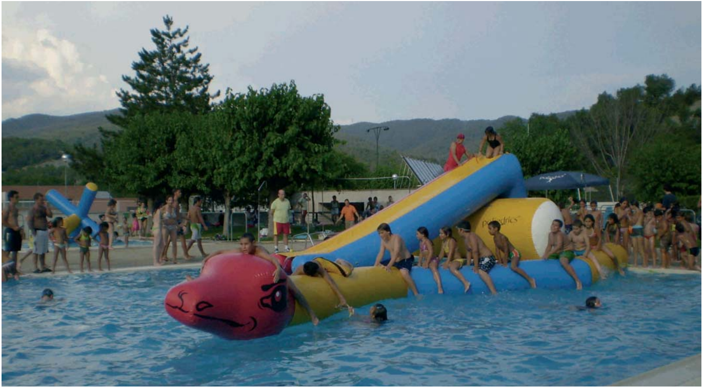
ELS INFLABLES A LA PISCINA VAN FER PASSAR UNA ESTONA DIVERTIDA A LA QUITXALLA PER LA FESTA MAJOR