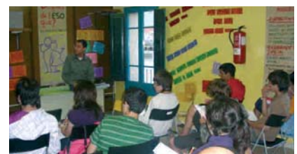
LA XERRADA ES VA FER AL CAU JOVE

d'informació detectada entre els joves sobre les opcions que tenen un cop finalitzen l'ESO. A l'acte hi van assistir no només jovent del nostre poble sinó també de municipis veïns. A més de la xerrada, el Cau Jove va acollir una exposició amb el títol "Després de l'ESO què faig?".