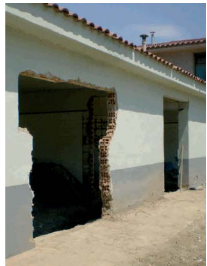
ACTUACIÓ ALS VESTIDORS DEL CAMP DE FUTBOL

Construccions Munta, SL i suposa una inversió de 216.720,58 €. L'actuació consisteix en la construcció d'una nova planta sobre l'edifici existent. Tant a la part de baix com al primer pis hi haurà vestidors, amb dutxes, per a l'equip local, el visitant i els àrbitres. A la primera planta també es disposarà d'un espai per a magatzem. La tercera de les obres incloses dins el FEIL és l'adaptació de diferents voreres del poble per millorar-ne l'accessibilitat. L'actuació la realitzarà Construccions Isari 2000, SL i compta amb un pressupost de 29.714,32 €. Es preveu que comenci properament. Aquestes tres actuacions està previst que estiguin enllestides abans d'acabar l'any.