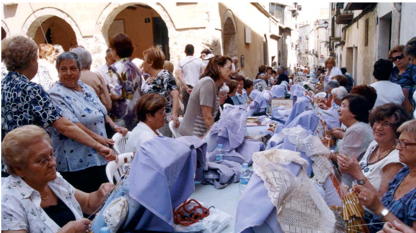
IX TROBADA DE PUNTAIRES AL VOLTANT DELS CARRERS DEL NUCLI ANTIC

A més de totes aquestes propostes festives, els barris del municipi també han celebrat les seves festes. L'11 i el 12 de juliol es va fer a les Garrigues i el 25 d'aquest mateix mes, a les Cases Noves i al Xaró. (En el proper butlletí s'informarà més àmpliament sobre aquestes festes).