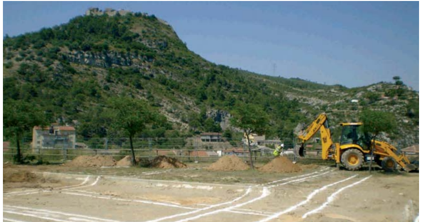
LES OBRES ES VAN INICIAR AQUEST MES DE JULIOL

L'obra compta amb una subvenció de 266.103,75 € del Pla Únic d'Obres i Serveis de Catalunya (PUOSC) i amb una ajuda econòmica màxima de 198.125 € del