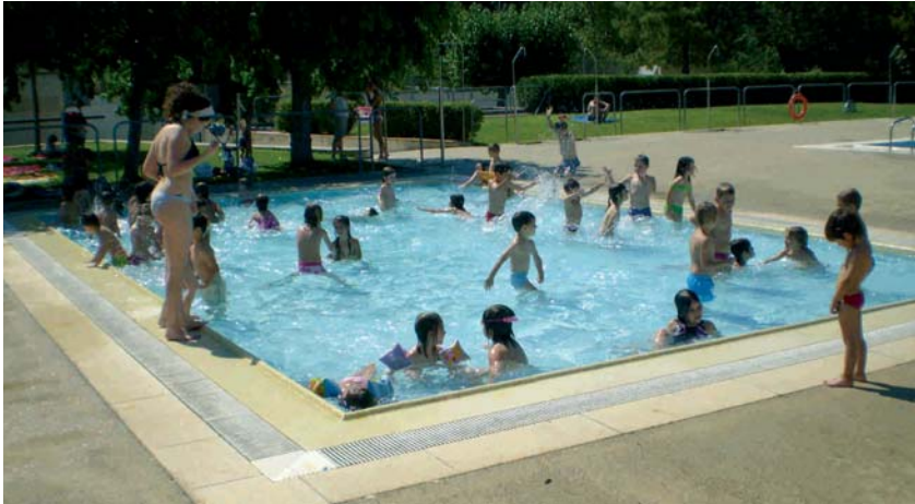
LES SORTIDES A LA PISCINA MUNICIPAL SÓN UNA DE LES ACTIVITATS DEL JUGA A L'ESTIU

Més de 140 nens i nenes, d'entre 3 i 12 anys, participen en el Juga a l'Estiu, que organitza la regidoria d'Infància i Joventut. Cal destacar que enguany aquesta activitat, que es va iniciar el 29