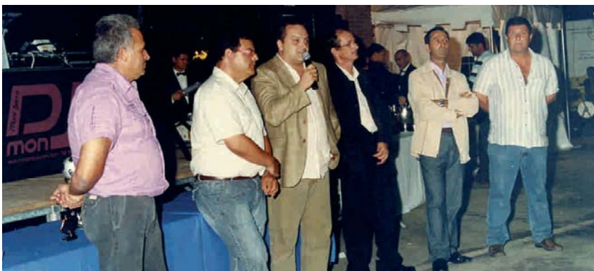
PARLAMENT DE L'ALCALDE ABANS DEL LLIURAMENT DE TROFEUS

La resta d'equips del futbol base van quedar classificats de la manera següent: els juvenils, setens, amb 49 punts; els cadets, novens, amb 35 punts; els infantils, novens, amb 32 punts; els prebenjamins, tretzens, amb 7 punts; i els alevins, quinzens, amb 59 punts. Pel que fa a l'equip amateur va quedar catorzè, amb 41 punts.