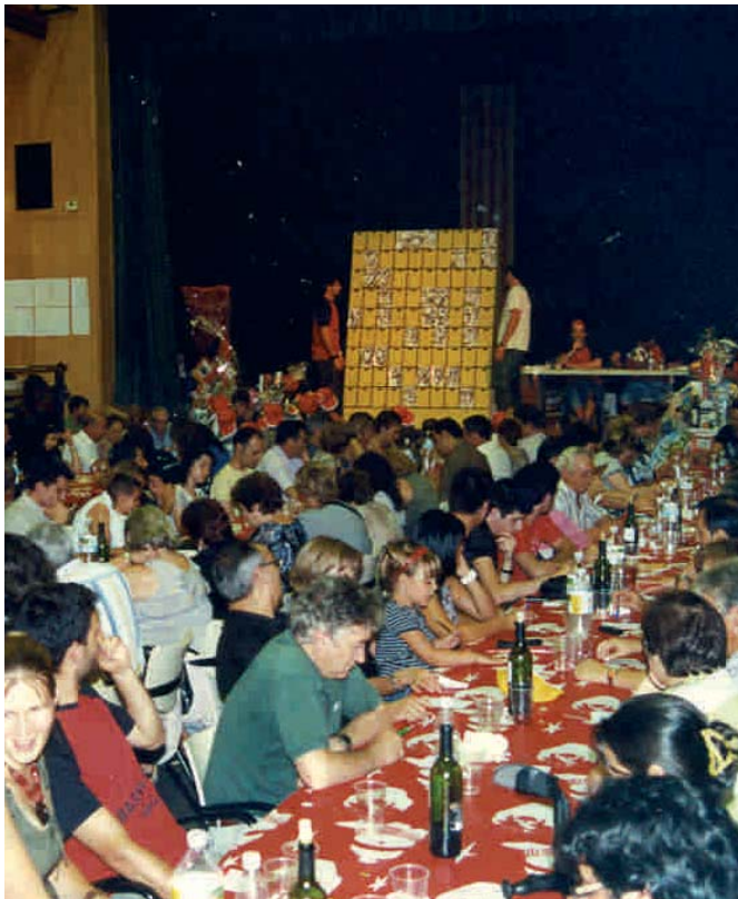
BINGO SOLIDARI DE LA SETMANA DE LA JOVENTUT