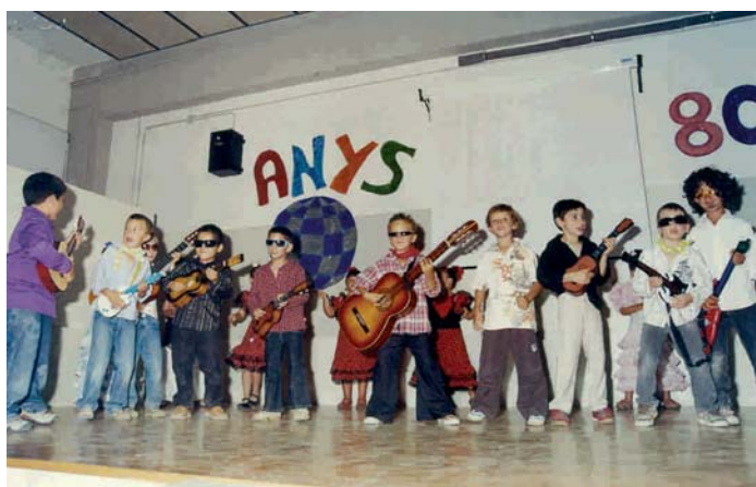
REPRESENTACIÓ DELS ALUMNES DURANT LA FESTA

El CEIP Maria Borés va acollir el dissabte 13 de juny la festa de fi de curs. L'acte el van organitzar, conjuntament, els mestres i l'Associació de Mares i Pares d'Alumnes (AMPA) i va comptar amb el suport de l'Ajuntament.