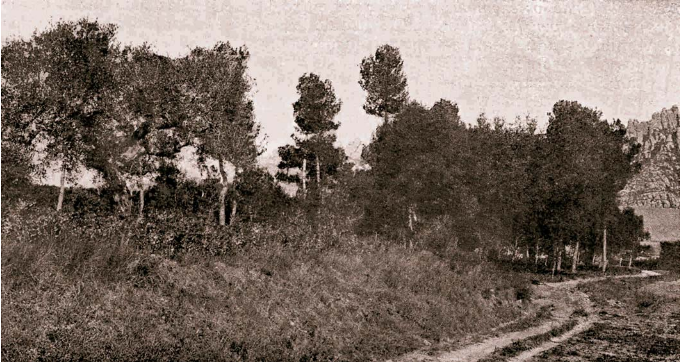
LA CARRETERA DEL PLA DE L'ALZINAR VA SER UN DELS ESCENARIS DE LES BATALLES DEL BRUC

Des del principi de la invasió de les tropes napoleòniques la resistència va ser operativa i la mobilització d'homes i de recursos seria immediata. Però tot era limitat i d'impossibles no se'n podien fer. Per això, la Junta i l'Ajuntament de la Poble es van haver d'exclamar: