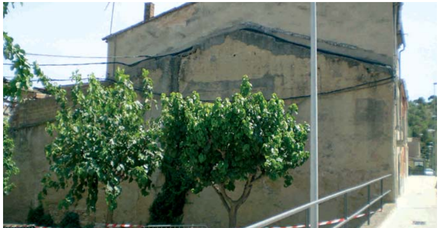
LATERAL DE L'EDIFICI QUE HA ADQUIRIT RECENTMENT L'AJUNTAMENT