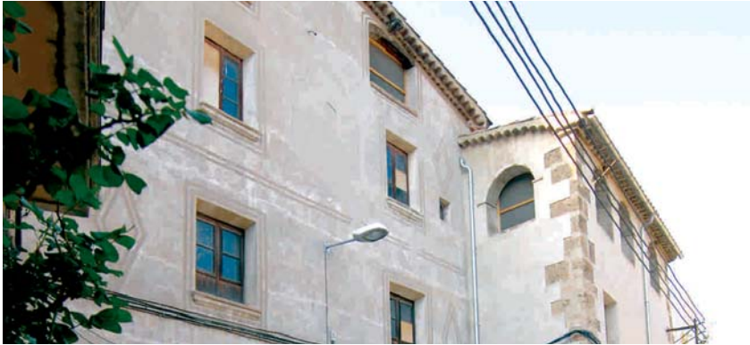
ES FARÀ UN ESTUDI PER UBICAR UN MUSEU A L'EDIFICI DEL CELLER D'ART

L'Ajuntament i la Diputació de Barcelona han signat recentment un conveni per al suport tècnic, jurídic i econòmic en polítiques d'habitatge, urbanisme i activitats. El text d'aquest document es va aprovar, per unanimitat, en el Ple ordinari del dijous 12 de març.