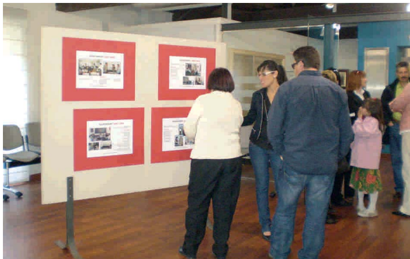
A LA SALA DE PLENS HI HAVIA UN RECURLL D'IMATGES DE LA CONSTITUCIÓ DELS DIFERENTS AJUNTAMENTS

El 19 d'abril de 1979 es van constituir els primers ajuntaments democràtics, després de quatre dècades de dictadura. Per celebrar aquesta data tan significativa per a la política local, l'Ajuntament va organitzar aquest dia una jornada de portes obertes a l'edifici consistorial. Diversos poblatans i poblatanes, entre les 12 i les 2 del migdia, van poder veure les diferents dependències municipals, com el despatx de l'alcalde, el departament dels tècnics o la sala de Plens. En aquest espai hi havia un recull d'imatges de la constitució dels ajuntaments del nostre municipi des de 1979 fins a l'actualitat.