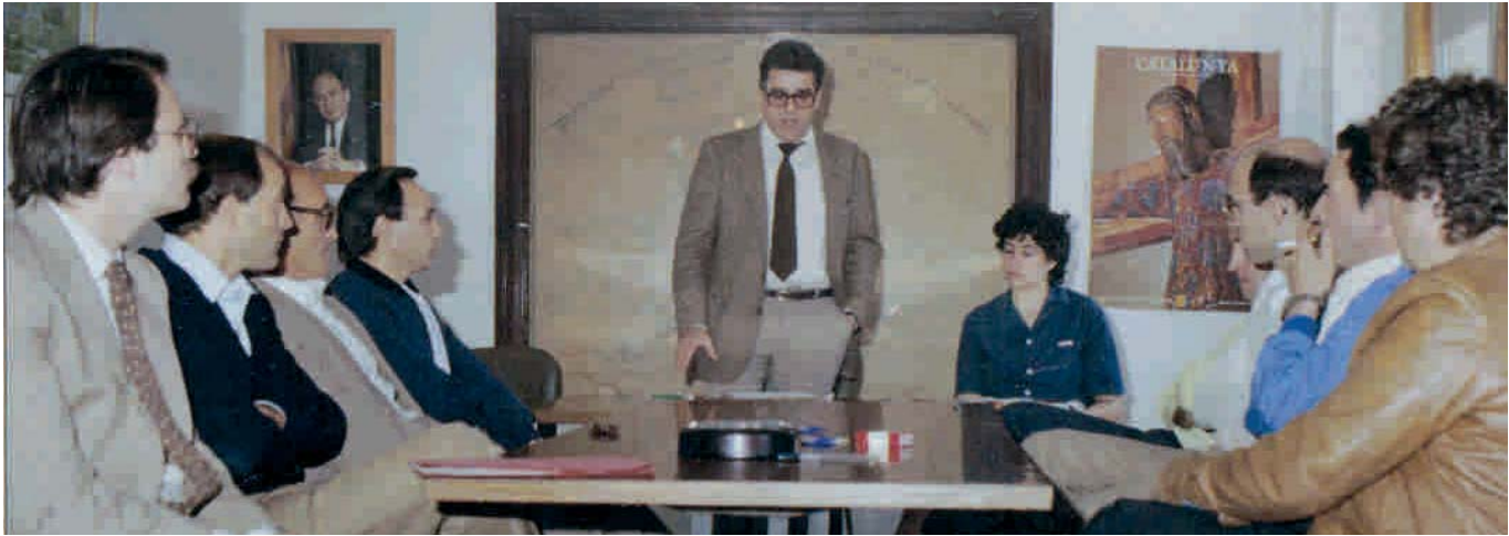
CONSTITUCIÓ DEL SEGON AJUNTAMENT DEMOCRÀTIC DE LA POBLA DE CLARAMUNT (MAIG DE 1983)