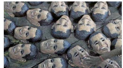
MÀSCARES DE BARACK OBAMA