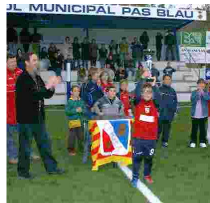
ACTE DE LLIURAMENT DE TROFEUS DEL CAMPIONAT BENJAMÍ

A la fase preliminar, dins del grup A, es van disputar tres partits: Vilanova-Òdena (3-1), Vilanova-Masquefa (1-15) i Òdena-Masquefa (3-9). I dins del grup B també es van jugar tres enfrontaments: Capellades-la Pobla (0-11), Capellades-Carme (3-5) i la Pobla-Carme (6-1). Per al cinquè i sisè lloc es van enfrontar l'Òdena i el Capellades, que van empatar a dos gols, i finalment va aconseguir guanyar l'equip odenenc per penals. En semifinals es van enfrontar el Masquefa contra el Carme (14-1) i la Pobla contra el Vilanova (10-0). El tercer lloc del campionat el va aconseguir el Carme que va derrotar el Vilanova amb un resultat de 5 a 8. Pel que fa a la final la Pobla es