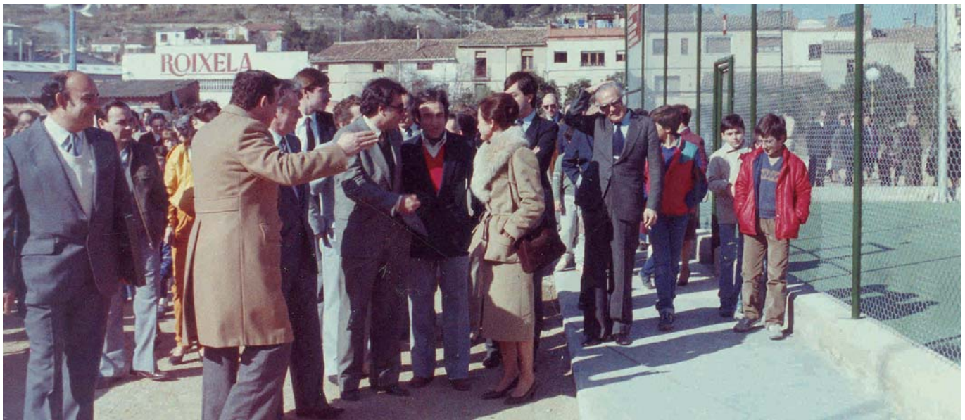
INAUGURACIÓ DE LES DUES PRIMERES PISTES (1984)

Com a colofó de la celebració dels 25 anys, els dos dies de juny esmentats, al Local Social, es podrà veure la Copa Davis que Espanya va guanyar a Argentina el 2008.