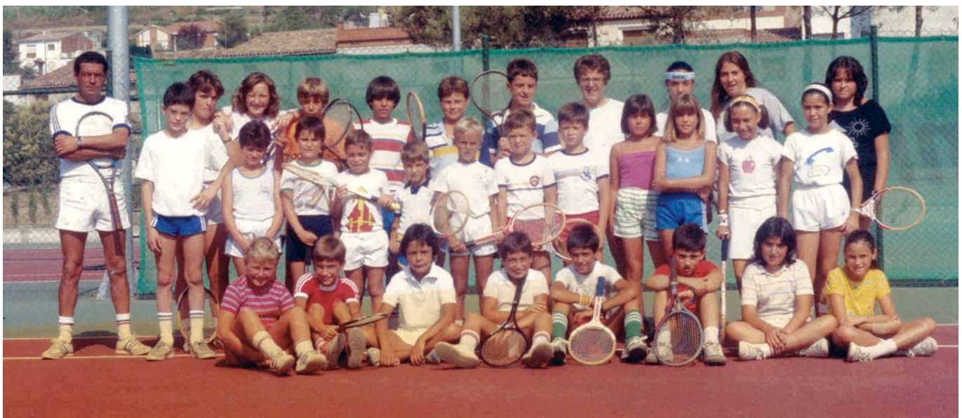
NENS I NENES DE LA PRIMERA ESCOLA DE TENNIS (1984)