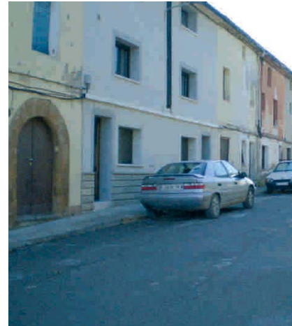
IMATGE ACTUAL DEL BARRI DE LA RATA

La tercera obra inclosa dins del FEIL és