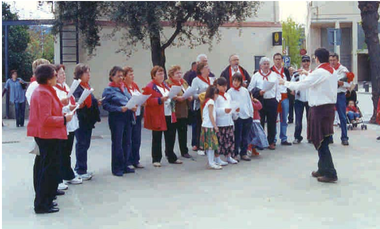
CANTADA DE CARAMELLES A LA PLAÇA DE L'AJUNTAMENT

La Coral la Lira va organitzar un any més, i com és ja és tradicional pels voltants de Setmana Santa, la cantada de caramelles. L'activitat, que es va fer el diumenge 19 d'abril, va començar cap a les 10 del matí i es va allargar fins al migdia.