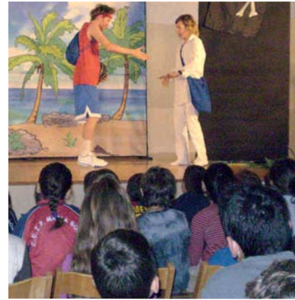
REPRESENTACIÓ A L'ESCOLA DE L'OBRA PIRATE ISLAND

A la llar d'infants Sol Solet i al CEIP Maria Borés també van celebrar la diada. Els nens i les nenes de l'escola bressol van confeccionar la titella d'un drac amb material reciclat i les mestres els van explicar la llegenda de Sant Jordi i els van llegir diversos