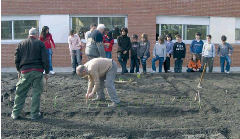
EL PROJECTE HA COMPTAT AMB LA COL-LABORACIÓ DE TRES AVIS DELS ALUMNES

El CEIP Maria Borés està portant a terme un projecte per donar a conèixer als alumnes de primària com es té cura d'un hort. Aquesta activitat s'inclou dins del Projecte d'Innovació Educativa de Medi Ambient, subvencionat pel departament d'Educació de la Generalitat.