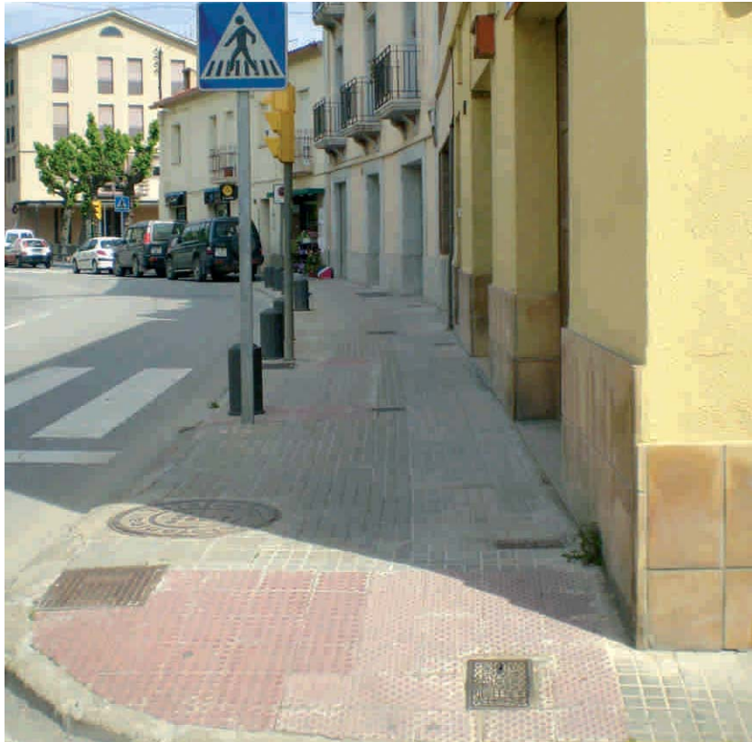
UNA DE LES VORERES DEL CENTRE DEL POBLE QUE S'ADAPTARÀ PER MILLORAR-NE L'ACCESSIBILITAT

L'Ajuntament ha adjudicat, definitivament, les tres obres incloses dins del Fons Estatal d'Inversió Local (FEIL), la línia d'ajuda econòmica que el govern de l'Estat ha atorgat als ajuntaments. Al nostre poble aquesta aportació és de 388.135 i les actuacions han d'estar acabades abans que finalitzi aquest any.