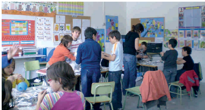
ELS NENS I LES NENES VAN PARTICIPAR EN DIFERENTS TALLERS

Més d'una setantena de nens i nenes, d'entre 3 i 12 anys, van participar en una nova edició del Juga a la Primavera. L'activitat es va fer del 6 al 9 d'abril al CEIP Maria Borés i la va organitzar la regidoria d'Infància i Joventut. En total hi va haver 72 nens i nenes, dividits en tres grups, i es va comptar amb vuit monitors. Les activitats en què van participar els infants van ser molt diverses, com fer un ou de Pasqua, confeccionar una flor de primavera, un marc de fotos o participar en un taller d'aliments.