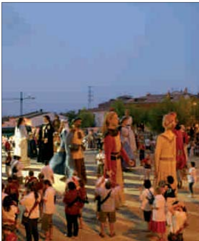
TROBADA GEGANTERA A SANT LLORENÇ D'HORTONS

Els gegants i els capgrossos del nostre municipi van participar durant el 2008 en diferents sortides a poblacions de la geografia catalana. Per a aquest any la trobada més destacada en què serà