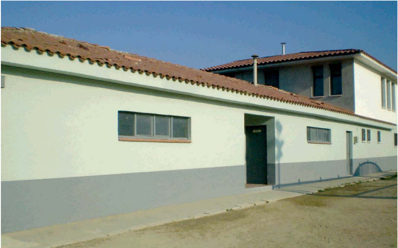
IMATGE ACTUAL DELS VESTIDORS DEL CAMP DE FUTBOL

amb un pressupost de 216.720,58 €. El projecte es va aprovar, inicialment, en el Ple extraordinari del 30 de desembre de 2008. La intervenció consistirà en la construcció d'una nova planta sobre l'edifici existent. A la part de baix hi haurà els vestidors, amb dutxes, de l'equip local, del visitant i dels àrbitres. I a la primera planta també hi haurà vestidors per a l'equip local i el visitant, amb dutxes, i una zona de magatzem. Amb la realització d'aquesta obra es completaran, finalment, les millores a la zona esportiva municipal.