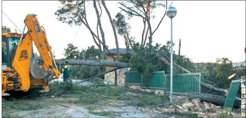
EL PAISATGE DEL XARÓ DESPRÉS DEL TEMPORAL ERA DESOLADOR

A més d'aquestes destrosses hi va haver problemes amb les línies telefòniques i durant algunes hores no es va disposar d'aquest servei. La majoria dels