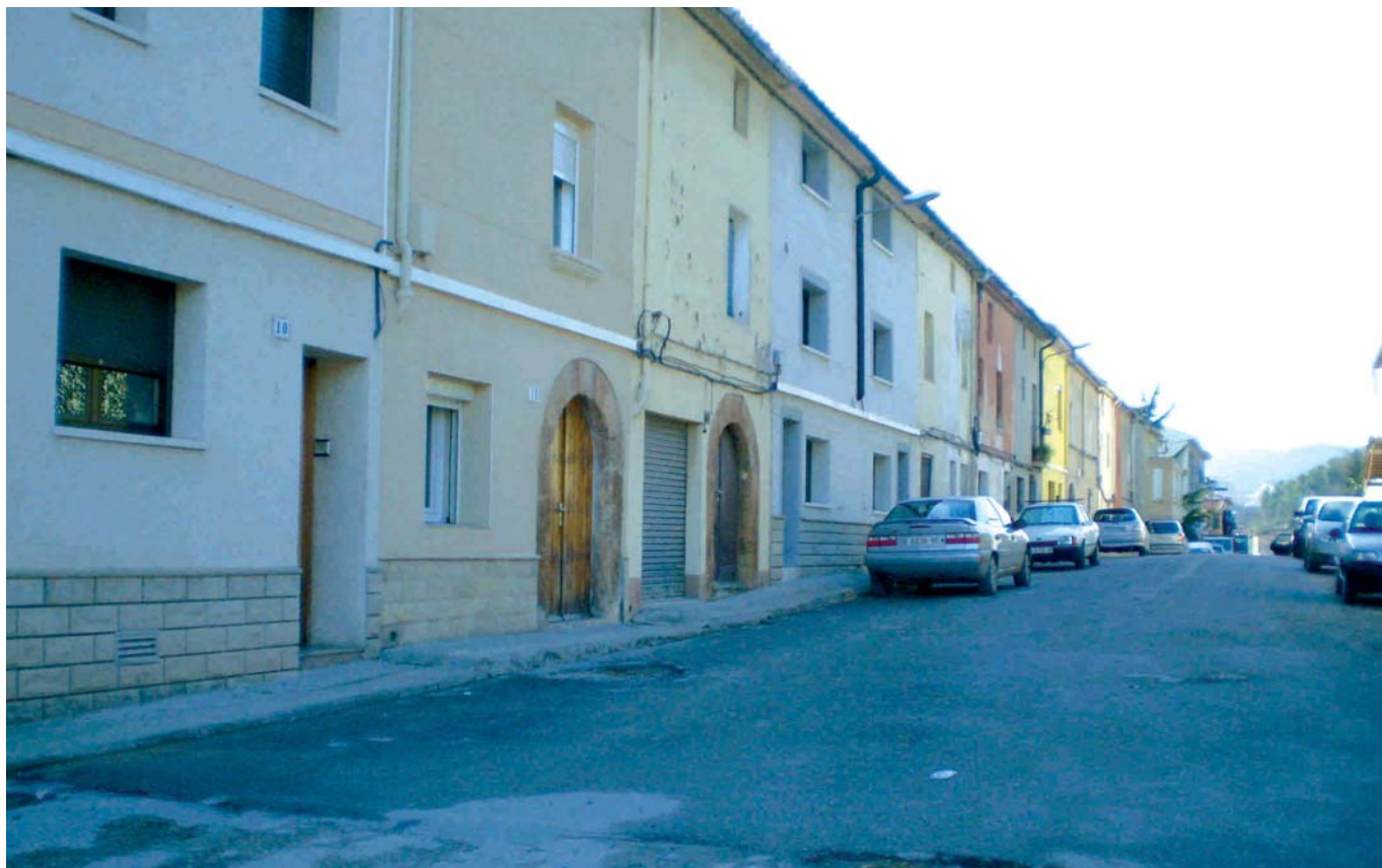
ES FARAN DIVERSES MILLLORES AL BARRI DE LA RATA