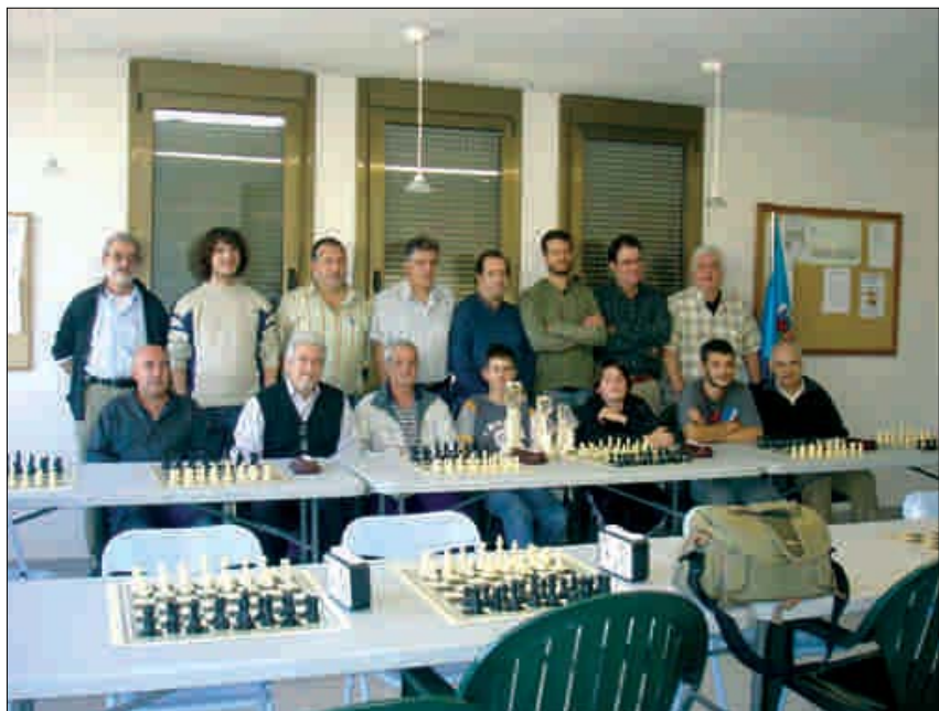
MEMBRES DE L'EQUIP D'ESCACS DEL CT LA POBLA

Enguany els poblatans juguen amb un grup més fort que el de la temporada passada. Els equips participants són: Vilafranca B, Cervelló, Castelldefels B, Martorell B, Prat B, Ateneu Igualadí, Sant Joan Despí B, Sant Feliu D i Peón Doblado de Cornellà. Els cinc primers lluiten per pujar de categoria mentre que la resta, junt amb la Pobla, faran els possibles per