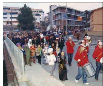
RUA DE CARNESTOLTES PELS CARRERS DEL POBLE

A l'Ateneu es va fer el fi de festa. Un cop es van aplegar totes les disfresses al local va començar una pluja de confeti, animada per la música d'una discomòbil. Es van llençar uns 100 quilos de paperets, que van fer passar una estona divertida a petits i grans. També es va repartir berenar per a la quitxalla que anava disfressada.