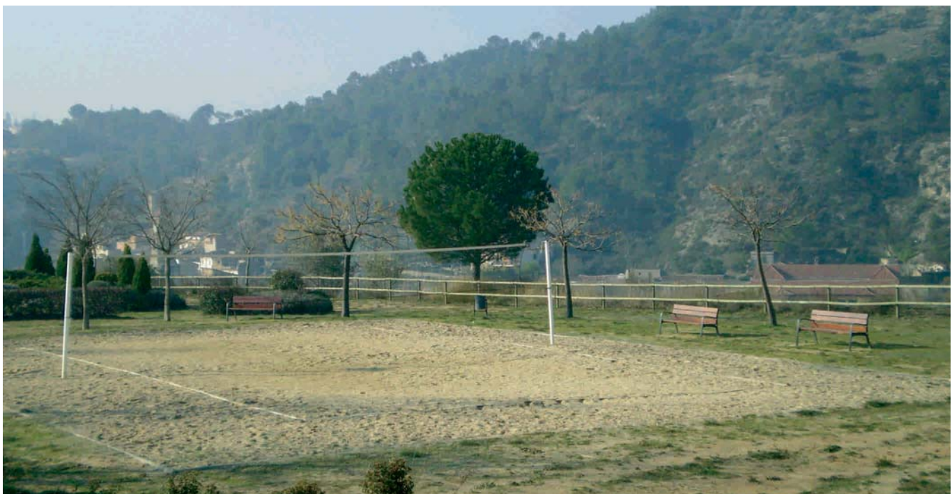
TERRENYS ON S'UBICARÀ LA NOVA LLAR D'INFANTS, A LA ZONA DE CAN GALAN

A més de tots aquests projectes, es reformarà la coberta del Local Social del barri de les Garrigues . L'obra ja s'ha adjudicat a l'empresa Construccions Isari, 2000 per un import de 10.212 €, que es cobriran amb un préstec. L'actuació està previst que s'iniciï properament.