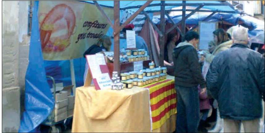
EL MERCAT DE PRODUCTES ARTESANALS I D'ALIMENTACIÓ ES VA FER AL VOLTANT DELS CARRERS DEL NUCLI ANTIC

En aquesta plaça s'oferia als visitants una branca de romaní i una infusió de poníol calenta per donar un punt de calidesa al