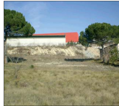
TERRENYS ON S'UBICARÀ LA DEIXALLERIA MUNICIPAL

El residus que es podran dipositar a la deixalleria seran diversos, com fluorescents, pneumàtics, piles, ferralla, electrodomèstics o runes i restes d'obres menors. Els objectes i materials es podran llençar en diferents contenidors i també hi haurà una caseta prefabricada de 10 m 2 que es destinarà a oficina i serveis. Es construirà una marquesina per tal de cobrir l'espai destinat