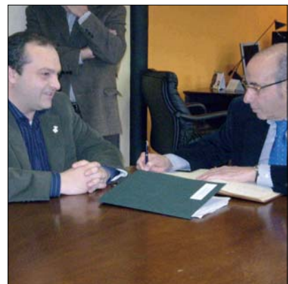
EL CONSELLER VA SIGNAR EN EL LLIBRE D'HONOR DE L'AJUNTAMENT

Durant la visita Baltasar va anunciar l'obertura d'una línia d'ajuts per als propietaris de boscos privats afectats pel temporal de vent. Al nostre municipi, segons dades de la Direcció General del Medi Natural, van quedar malmeses entre un 50 % i un 75 %, 21,4 hectàrees de massa forestal, i menys d'un 50 %, 16,7 hectàrees.