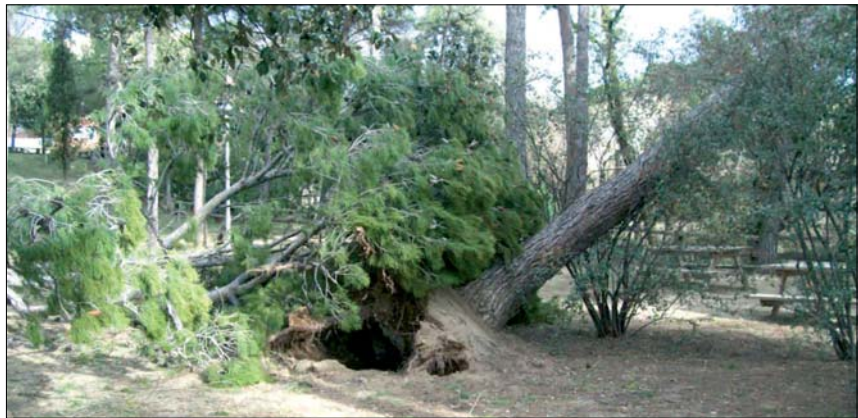
PINS DEL PARC DEL MIL·LENARI ARRENCATS DES DE LA SOCA

desperfectes ja s'han anat arranjan, però encara en queden per solucionar, com algun pal de Fecsa o algun fanal. Com que al nostre municipi les ràfegues de vent van superar els 135 quilòmetres