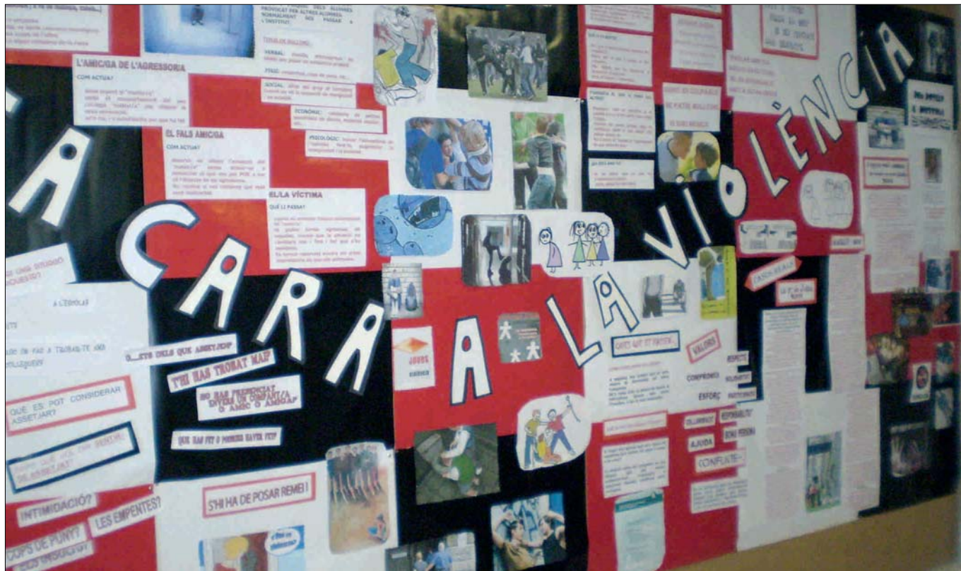
L'EXPOJOVE SOBRE VIOLÈNCIA ES PODRÀ VISITAR FINS A MITJAN DE JUNY

"Planta cara a la violència" és el títol de la mostra que es recull a l'espai de l'Expojove i que es podrà veure fins a mitjan del mes de juny. Aquesta problemàtica cada vegada marca més la societat actual i fa que ens haguem de plantejar mesures per trobar-hi una solució, una sortida.