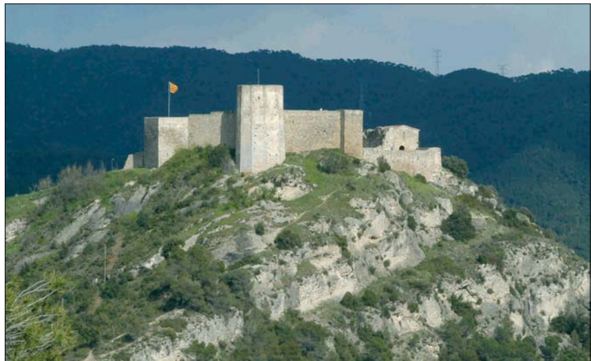
EL CASTELL DE CLARAMUNT ES DIVISA DES DE DIFERENTS PUNTS DE LA COMARCA

En la categoria de castells privats el guanyador va ser el Castell de Mataplana, de Gombren, al Ripollès. A