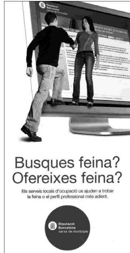
PORTADA DEL FULLET DE LA DIPUTACIÓ PER INFORMAR SOBRE ELS SERVEIS D'ORIENTACIÓ LABORAL

En aquest díptic s'informa que el Servei d'Orientació Laboral té com a finalitat informar, assessorar i gestionar aspectes relacionats amb l'ocupació. Els serveis que es poden donar es divideixen en dos àmbits: per a les persones i per a les empreses. Per a les persones s'ofereix: informació general sobre ocupació, orientació laboral personalitzada, selecció d'ofertes de treball adequades al perfil professional, formació, pràctiques laborals en empreses i borsa de treball. Per a les empreses s'ofereix: informació i assessorament, difusió de les ofertes de treball, selecció de personal i