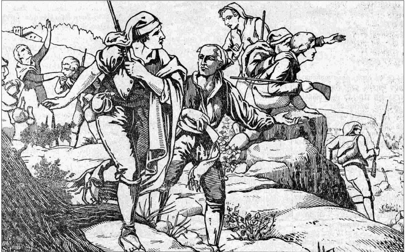
DIBUIX AL·LEGÒRIC DE LES BATALLES DEL BRUC (1808)

A les famoses i victorioses batalles del 6 i del 14 de juny de 1808 als indrets del Bruc, amb la derrota d'unes formacions militars napoleòniques, també hi van combatre alguns poblatans, ja fos com a membres del Sometent o com a voluntaris, o fins i tot mobilitzats de lleves. Aquesta participació es recull en unes actes notariais protocol·litzades per Josep Antoni Ferrer Vilalta, d'Igualada, i en les diligències efectuades al nostre poble.