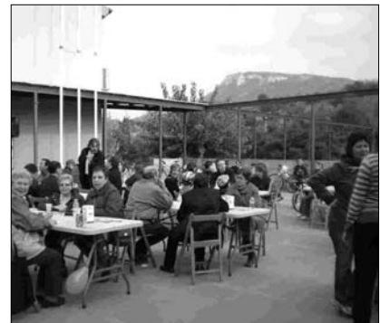
ESMORZAR POPULAR A LA PLAÇA DE L'AJUNTAMENT

Des de la delegació de l'Associació Espanyola contra el Càncer es va agrair la col·laboració del Consistori i dels poblatans i les poblatanes per tirar endavant la iniciativa solidària.