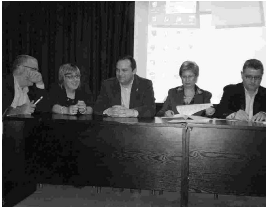
L'ALCALDE, EN EL MOMENT DE LA SIGNATURA DEL CONVENI

La Xarxa Intermunicipal TET compta amb el suport de la Diputació de Barcelona. En el text del conveni s'especifica que els municipis signants tenen "el compromís de treballar per avançar de forma conjunta en la millora de la formació i la igualtat d'oportunitats dels joves i contribuir al desenvolupament econòmic i social del territori" . El conveni tindrà una durada de quatre anys, que es podran prorrogar. Es crearà una comissió de seguiment, formada per representants de cada un dels ajuntaments que integren la xarxa i la