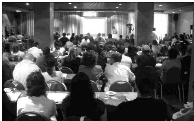
EL IV CONGRÉS NACIONAL DE MPS ESPANYA ES VA FER A MÚRCIA