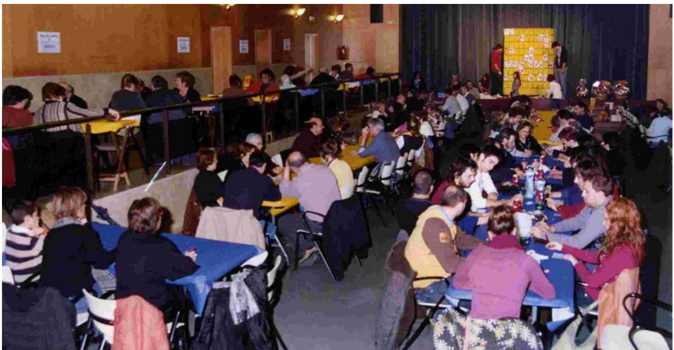
EL BINGO PER RECOLLIR FONS PER A LA MARATÓ VA ARRIBAR A LA CINQUENA EDICIÓ

La coral la Lira també organitza una activitat amb motiu d'aquestes festes. El dissabte 3 de gener a 2/4 de 9 del vespre a l'església oferirà un concert de Nadal. Els cantaires interpretaran cançons tan conegudes com Sant Josep i la mare de Déu , Les dotze van tocant o El 25 de desembre .