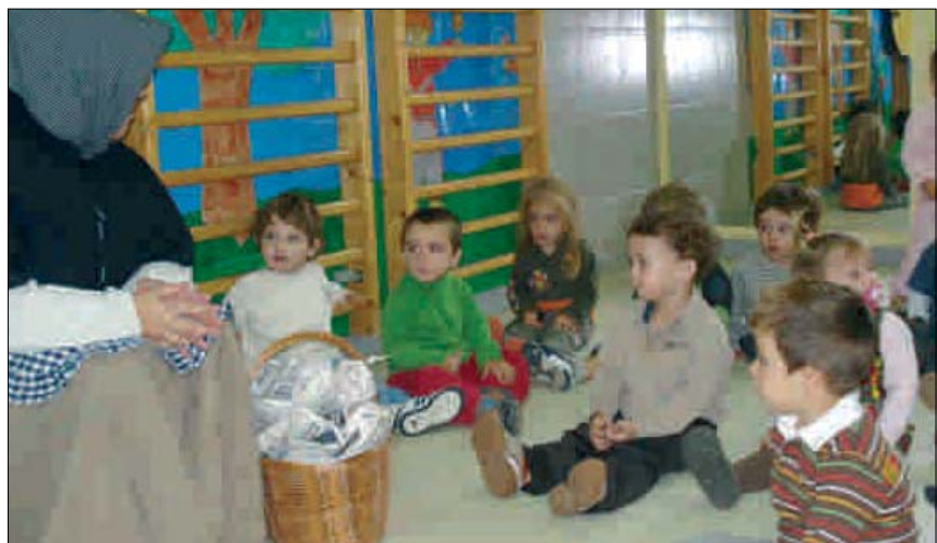
ELS NENS I LES NENES DE LA LLAR D'INFANTS VAN REBRE LA VISITA DE LA CASTANYERA

El dia 31 es va celebrar la castanyada. Una trentena de pares, mares i familiars van coure les castanyes. A l'escenari del