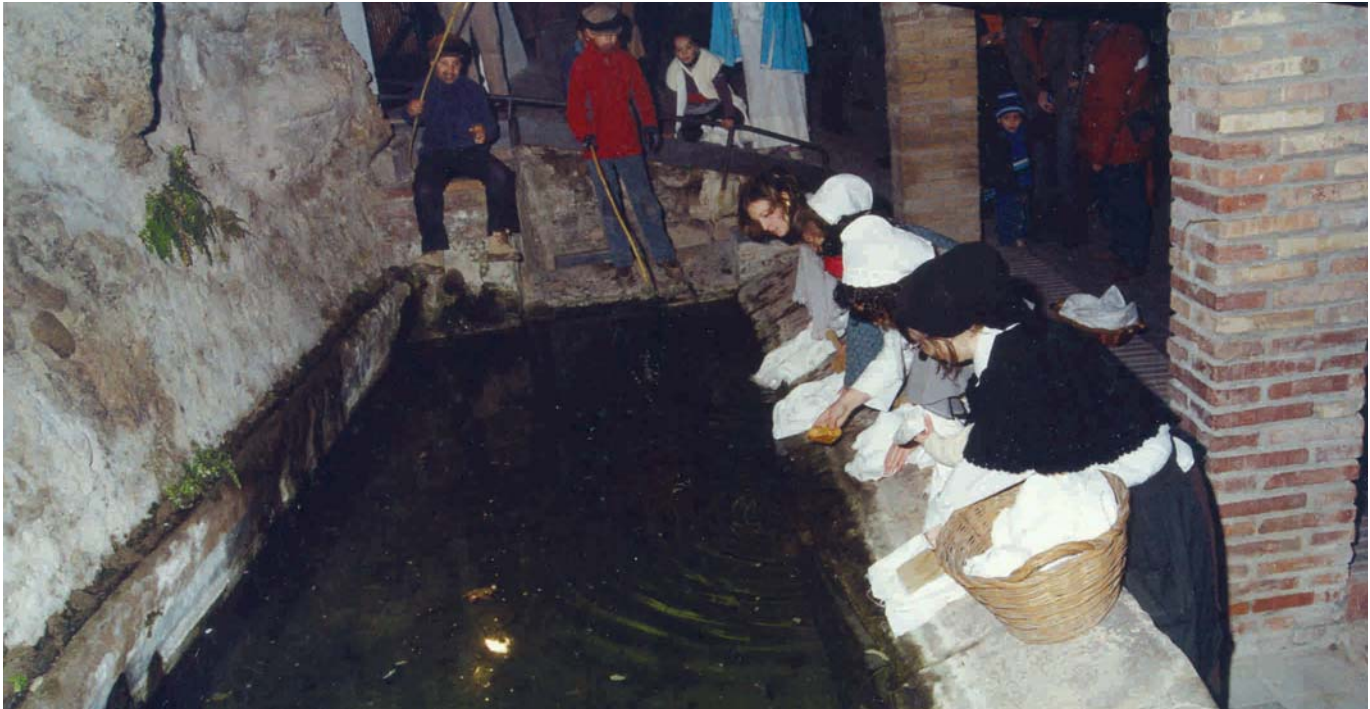
EL NUCLI ANTIC ACULL LES ESCENES DEL PESSEBRE VIVENT