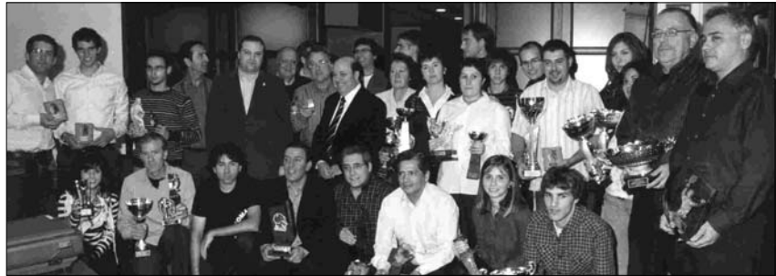
ELS PREMIATS DELS DIFERENTS CAMPIONATS SOCIALS I INDIVIDUALS

Després dels parlaments, es va fer el lliurament de trofeus als millors classificats dels diferents campionats socials de dobles