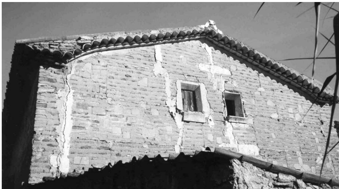
ARTÍSTIC RÀFEC D'OBRA CUITA D'UNA CASA DELS MASETS (2006)