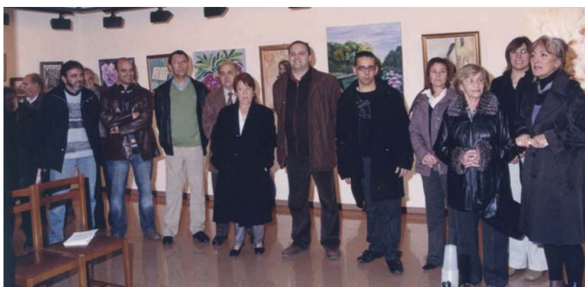
INAUGURACIÓ DE L'EXPOSICIÓ DE PINTORS POBLATANS

guerrers i moltes altres disfresses van recórrer el dissabte els carrers poblatans. La rua, animada pel grup Alaigua Teatre, va sortir a les 6 de la tarda des de la plaça dels Països Catalans i, després de fer un recorregut pel poble, va arribar, cap a les 7, a l'Ateneu.