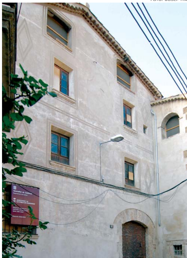
L'EDIFICI DEL CELLER D'ART, PROPIETAT MUNICIPAL, ESTÀ UBICAT AL BARRI DE LES FIGUERES

d'enguany s'inclou una partida de 36.000. També es farà una nova senyalització vial i els serveis tècnics municipals ja estan treballant en el projecte de reforma de l'actual Local Social, que funcionarà fins que no es construeixi el nou. Aquestes reformes consistiran en refer la coberta de l'edifici i pintar-lo.