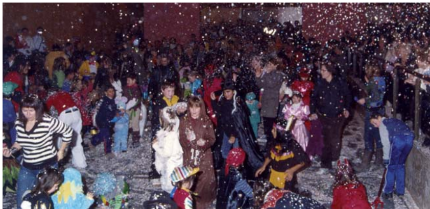
L'ATENEU VA ACOLLIR EL FINAL DE LA RUA DE CARNESTOLTES

Un carnestoltes molt participatiu Indis, princeses, fades, cavallers,