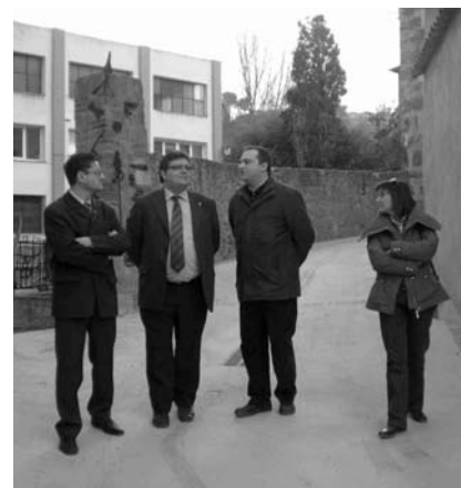
ELS DOS DIPUTATS, L'ALCALDE I LA REGIDORA DURANT LA VISITA AL CELLER D'ART

El Celler d'Art, també conegut com a cal Fuster, està ubicat al barri de les Figueres. El 2004 ja es va fer una intervenció en aquest edifici que va consistir en la consolidació de la teulada i en la millora de la façana. Aquesta actuació va comptar amb una subvenció de la Generalitat.