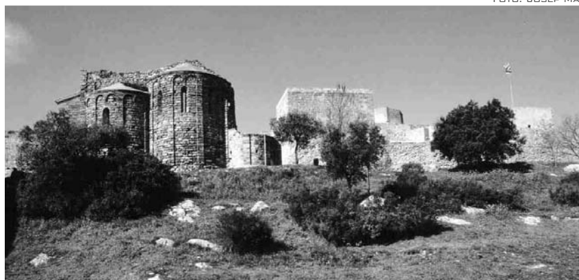
EL CASTELL DE CLARAMUNT VA OBRIR LES PORTES AL PÚBLIC EL JULIOL DE 1997

Una altra dada que cal destacar és que el monument medieval està a punt de superar la franja de les 70.000 visites, des del dia que va