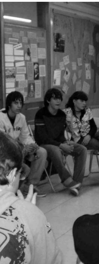
EL CAU JOVE VA OBRIR LES PORTES EL 2005

L'any 2005, amb la posada en marxa dels Plans Locals de Joventut, la Pobla de Claramunt va fer una aposta important en les polítiques adreçades als joves. Es va crear la regidoria de Joventut i es van obrir les portes del Cau Jove. També es va contractar una tècnica i una dinamitzadora juvenil per tirar endavant les actuacions dirigides al jovent. El Pla Local és una eina que facilita el desenvolupament d'una política integral de joventut per donar resposta a les necessitats dels joves. Gràcies al Pla Local 2005-2007 al nostre municipi es va donar un gran impuls a les accions destinades al jovent. Amb el nou document, que tindrà vigència del 2008 al 2011, es volen consolidar aquestes polítiques.