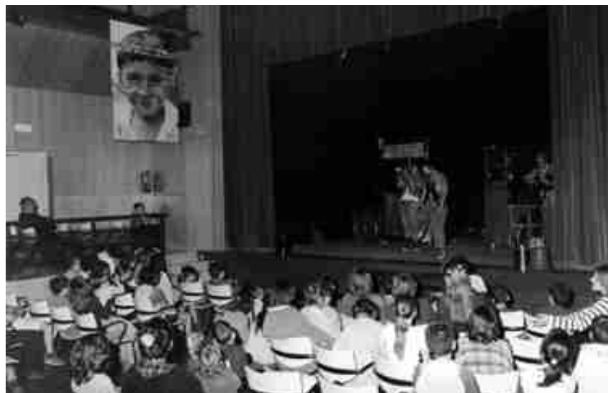
ESPECTACLE DE PALLASSOS SENSE FRONTERES A L'ATENEU

Insausti va fer una reflexió sobre la cultura de la pau al món. El conferenciant va reconèixer que "és difícil aconseguir un món totalment en pau, però s'ha de caminar en aquesta direcció" .