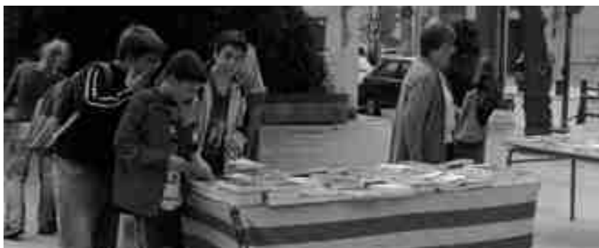
LA VENDA DE LLIBRES I ROSES A LA PLAÇA DE L'AJUNTAMENT VA SER UN ÈXIT

Els alumnes, vestits amb diferents elements de l'Edat Mitjana, van participar en una sèrie de proves i jocs relacionats amb la vida medieval. Una altra activitat que es va organitzar per la Diada va ser la venda de llibres i roses a la plaça de l'Ajuntament. Membres de l'entitat Barrufet Roig van posar una parada i, durant tot el