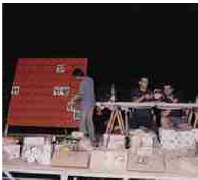
LA IV TROBADA DE PUNTAIRES VA APLEGAR 141 PARTICIPANTS