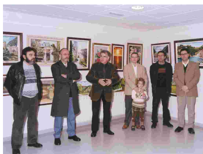
INAUGURACIÓ DE L'EXPOSICIÓ DE L'ASSOCIACIÓ SANFILIPPO ESPANYA

La Sala Canigó, situada a l'Ateneu, va acollir des del 21 de desembre fins al 11 de gener una exposició de quadres per a la recaptació de fons per a l'Associació Sanfilippo Espanya. En total es van vendre 11 quadres i es van aconseguir 2.200 euros, que es destinaran a aquesta entitat, que