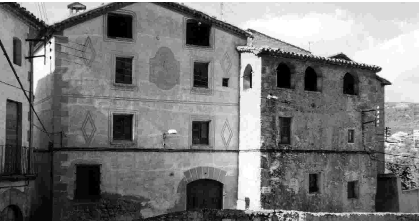
ACTUALMENT LA PROPIETAT DEL CELLER D'ART ÉS MUNICIPAL

EL SETEMBRE DE 1964 ES VA INAUGURAR EL CELLER D'ART I VA ADOPTAR COM A EMBLEMA UN PORRÓ AL DAMUNT D'UNA PALETA DE PINTOR