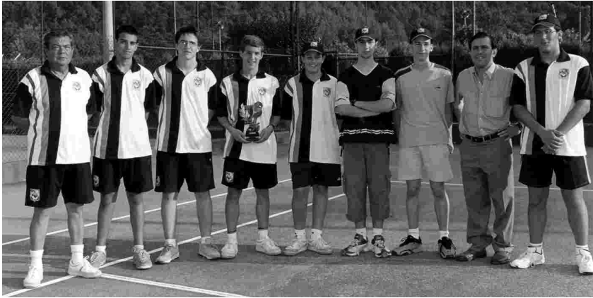
EQUIP CADET DEL CT LA POBLA

L'equip sènior i el cadet del Club Tennis la Pobla estan disputant diverses competicions. En concret, els primers estan jugant dins de la I Lliga de Tennis del Penedès i els segons, de la XII Lliga Juvenil del CD Terrassa Hoquei. Fins el partit disputat el passat 31 de gener,