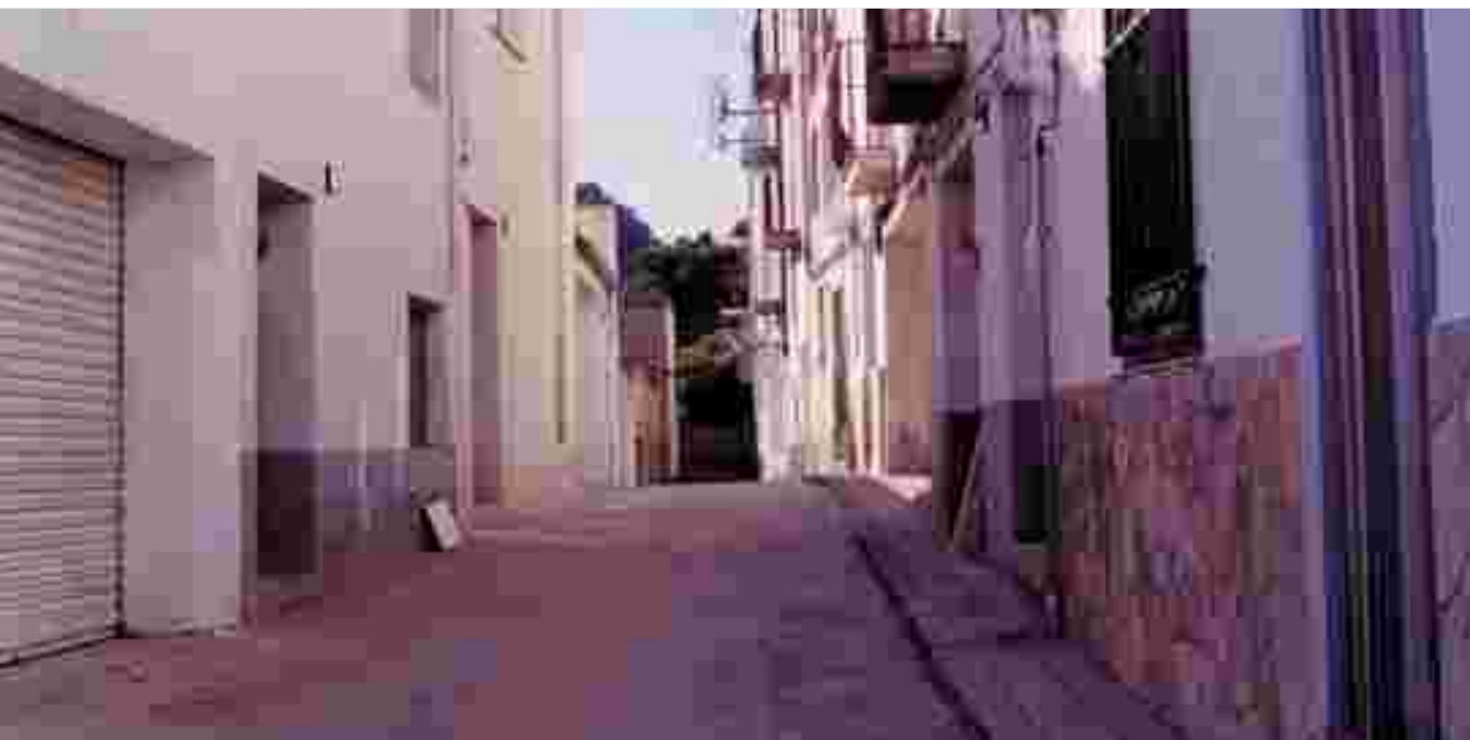
AL BARRI DE LES FIGUERES S'HA DE REALITZAR UNA IMPORTANT OBRA DE PAVIMENTACIÓ I MILLORA DELS CARRERS

L'AJUNTAMENT DESTINARÀ MÉS DE 800 MIL EUROS A INVERSIONS EN EL PRESSUPOST D'AQUEST ANY