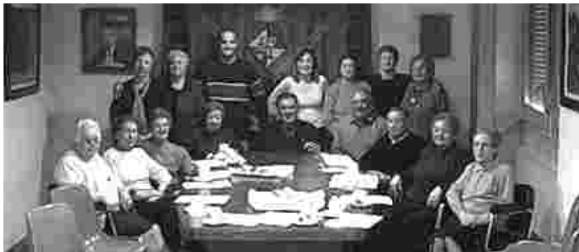
EL TALLER VA FINALITZAR AMB UN ESMORZAR I EL LLIURAMENT DE DIPLOMES

Les persones que van participar en el III Taller d'Entrenament de la