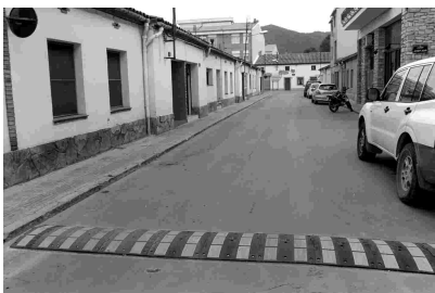
BANDES SONORES AL CARRER PARE ANTON SOTERAS

L'Ajuntament ha instal·lat en diversos carrers del municipi bandes