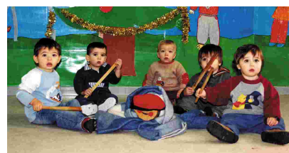
ELS NENS DE LA LLAR D'INFANTS SOL SOLET VAN FER CAGAR EL TIÓ

Reis i la regidoria de Cultura. Molts nens, acompanyats dels seus pares, van gaudir d'aquesta festa i es van repartir uns 300 quilos de caramels, alguns dels quals eren obsequi de diferents entitats bancàries. Altres activitats que van tenir lloc aquestes festes van ser el II Campionat Juvenil de Nadal de tennis, que van guanyar els jugadors poblatans davant el CT Montbui per 9 partits a 3; una exposició de ferro, forma i color; una representació de teatre dels alumnes d'anglès; un concert de Nadal a càrrec de la Coral la Lira