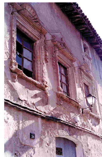
FAÇANA DE LA CASA DE CAL COCA QUE S'HA DE REHABILITAR PER ACOLLIR EL FUTUR AJUNTAMENT

L'ampliació de l'escola és una de les grans obres d'aquest any i d'aquest mandat. La intervenció, finançada per la Generalitat, suposarà la remodelació de l'edifici actual de primària, l'enderroc i la construcció de l'edifici d'educació infantil, la construcció d'un nou gimnàs, d'un menjador i de noves aules. També se suprimiran