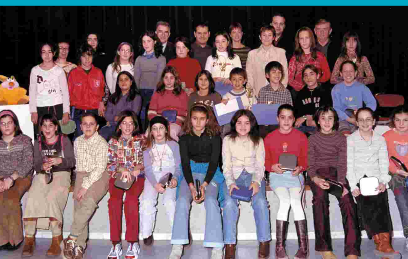
JURAT I NENS QUE VAN PARTICIPAR AL III CONCURS DE GUIONS DE TEATRE INFANTIL, ORGANITZAT PEL GRUP TEATRE JARDÍ - PÀG. 5