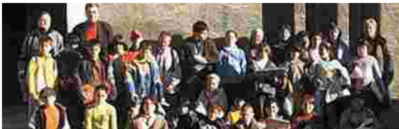
ALUMNES DE TERCER I QUART DAVANT DE L'AJUNTAMENT

Els alumnes de tercer i quart de l'escola Maria Borés van visitar el passat 26 de novembre l'Ajuntament per conèixer de manera directa com funciona l'administració local. Una trentena d'estudiants, d'entre 8 i 9 anys, van fer un recorregut per les instal·lacions