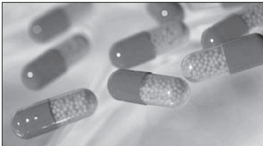
El consum de les drogues de síntesi es va estendre durant la dècada dels 90

En els darrers anys, el consum de drogues de síntesi ha crescut de manera espectacular. Molts joves associen la diversió amb aquestes substàncies i el cap de setmana és quan més en prenen. Les que més es consumeixen són: metanfetamina (speed), MDMA (èxtasi), GHB (èxtasi líquid) i ketamina. La majoria d'aquestes substàncies són estimulants, psicoactives i produeixen un augment de l'activitat, eufòria, disminució del cansament i altres canvis en el comportament dels consumidors.