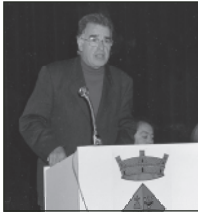
L'alcalde, acompanyat de la resta de membres de l'equip de govern, durant el seu parlament

Quant al segon eix, la creació de nous espais edificables i de