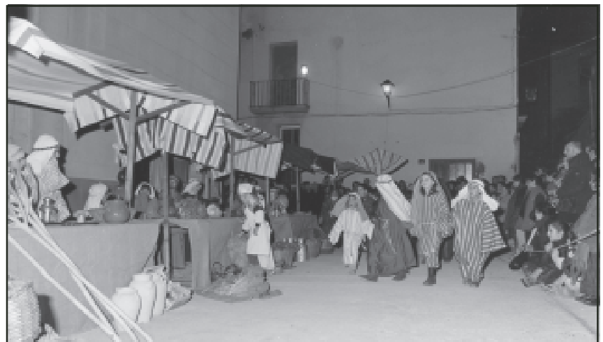
Una de les escenes del Pessebre Vivent, organitzat per un grup de poblatans

Després de la rebuda a la plaça de l'Ajuntament, que estava plena de gom a gom, Melcior, Gaspar i Baltasar van passar per les cases a lliurar els regals als nens. Ses Majestats van repartir 300 quilos de caramels, obsequi de l'Ajuntament, Caixa de Catalunya, La Caixa, Caixa del Penedès i el Banc de Sabadell.