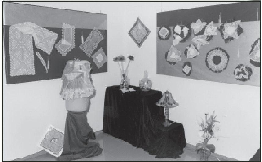
Treballs de puntes de coixí i de manualitats realitzats en els tallers de la gent gran

Al taller de gimnàstica hi participen una vintena de persones i les classes van a càrrec d'un professional de Fisioteràpia Anòia. Les sessions s'allargaran fins l'11 de juny i es fan els dilluns i els dimecres de les 10 a les 11 del matí al Teatre Jardí. Pel que fa al taller de manualitats,