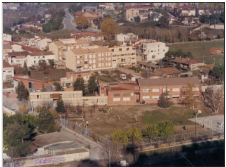
Imatge actual del CEIP Maria Borés

Des de l'entrada principal del centre, a la banda dreta de l'edifici actual de primària, la intervenció que es farà consistirà en en-