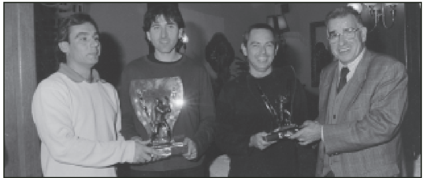
Lliurament de trofeus durant la Festa Social de Final de Temporada 2002

En el passat butlletí ja es va informar de la Festa Social de Final de Temporada 2002 del CT la Pobla, que va tenir lloc el 23 de