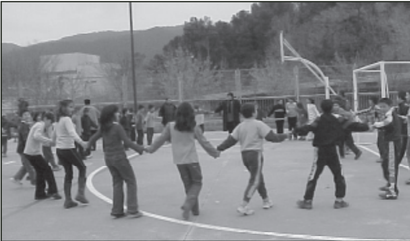
Ballada de sardanes final en què van participar tots els alumnes del centre