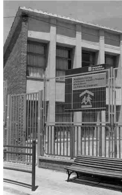
CARTELL COL·LOCAT AL PATI DE L'ESCOLA ON S'ANUNCIA L'OBRA D'AMPLIACIÓ

l'edifici actual de primària, l'enderroc i la construcció de l'edifici d'educació infantil, la construcció d'un nou gimnàs, d'un menjador i de noves aules. També cal destacar que se suprimiran les barreres arquitectòniques i que s'instal·larà un ascensor per comunicar la planta baixa i el primer pis. Aquesta actuació suposarà una gran transformació d'aquest centre educatiu per tal de donar uns millors serveis als alumnes i a la comunitat educativa en general.