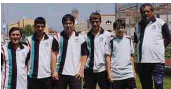
EQUIP SÈNIOR DEL CT LA POBLA

Pel que fa a l'equip cadet del CT la Pobla ha quedat en segona posició de la XII Lliga Juvenil del CD Terrassa Hoquei. El campió ha estat el CT Ripollet i el tercer, el Cercle Sabadellès.