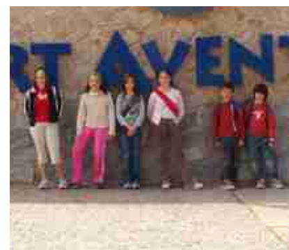
ELS GUANYADORS DEL CONCURS DE GUIONS A PORT AVENTURA

Els guanyadors, acompanyats de pares i membres del Grup Teatre Jardí, van passejar pels diferents indrets del parc i van pujar en algunes de les atraccions. Aquest viatge va ser obsequi de l'Ajuntament. A més d'aquesta sortida, els premiats van rebre un trofeu i un diploma.