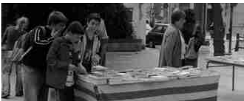
LA VENDA DE LLIBRES I ROSES A LA PLAÇA DE L'AJUNTAMENT VA SER UN ÈXIT

Els alumnes, vestits amb diferents elements de l'Edat Mitjana, van participar en una sèrie de proves i jocs relacionats amb la vida medieval. Una altra activitat que es va organitzar per la Diada va ser la venda de llibres i roses a la plaça de l'Ajuntament. Membres de l'entitat Barrufet Roig van posar una parada i, durant tot el