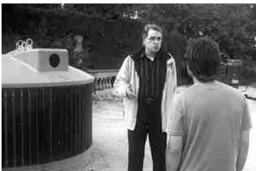
ENTREVISTA AMB L'ALCALDE SOBRE LA INSTAL·LACIÓ DE CONTENIDORS SOTERRATS

Els llums són de vapor de sodi, fet que suposa un important estalvi energètic i que minimitza l'impacte ambiental que pot tenir un altre tipus de lluminària. A més a més, els punts de llum tenen com a peculiaritat que no s'apaguen a les 12 de la nit, sinó que se'n redueix la intensitat.