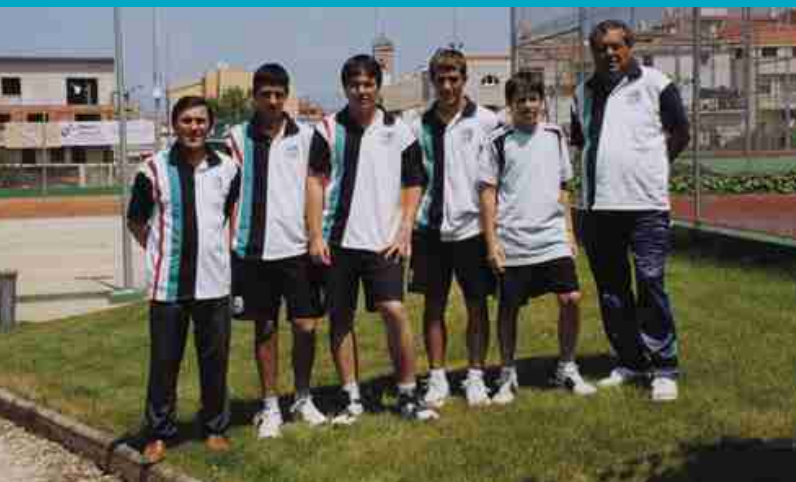
JUGADORS DE L'EQUIP SÈNIOR DE CT LA POBLA (PÀG. 10)