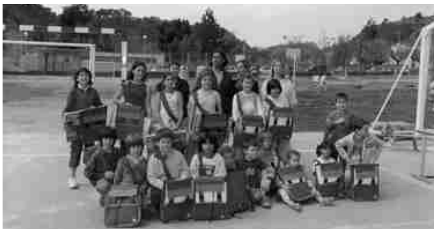
GUANYADORS DEL CONCURS LITERARI I ARTÍSTIC DE L'ESCOLA

La celebració de Sant Jordi al centre educatiu es va acabar a la tarda amb una gimcana medieval, que va servir de cloenda a les activitats realitzades dins del projecte "Temps de Castells".