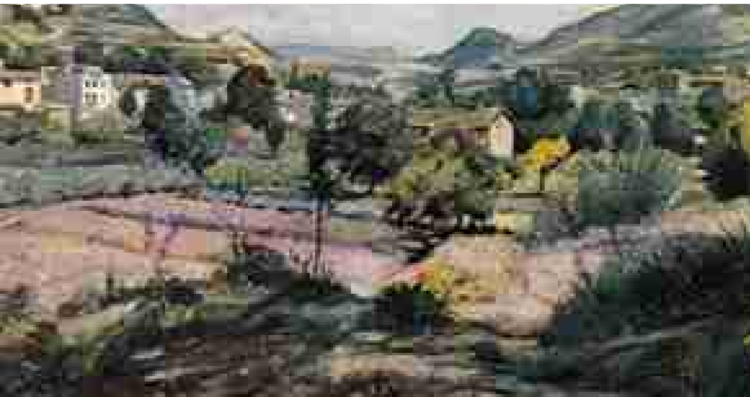
PINTURA DE LA POBLA OBRA DE JOSEP OBIOLS (1927)

Josep Obiols i la seva família van passar diversos estius al nostre poble. En concret, van ser els de 1927 i 1928 i del 1931 al 1935. En aquests temps, Obiols rebia cartes dels seus amics, els poetes Carles Riba i Josep Vicenç Foix, amb els quals va ser company d'escola i veí al carrer Major de Sarrià, a Barcelona.