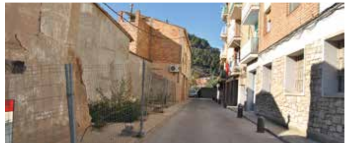
EIXAMPLAMENT I PERLLONGACIÓ DEL CARRER DE JOSEP JOVÉ

D'altra banda, per al 2014 l'Ajuntament té en projecte dues actuacions per adequar la travessera urbana de la carretera C-224 al seu pas per la Pobla, amb la finalitat de millorar la seguretat tant dels vehicles com dels vianants en aquesta artèria neuràlgica. S'hi col·locaran dos nous semàfors i s'hi faran quatre passos de vianants, a més d'una nova senyalització viària horitzontal i vertical. La senyalització horitzontal anirà a càrrec de la Generalitat.