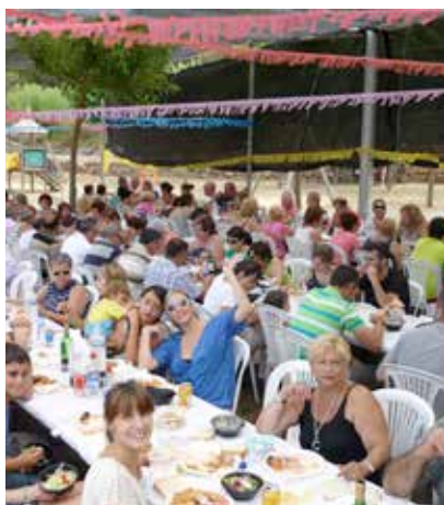
ASSISTENTS AL SOPAR POPULAR

El barri de les Garrigues es va tornar a vestir de festa del 12 al 14 de juliol. Durant aquests tres dies va ser l'escenari de diverses activitats lúdiques, que van obtenir una gran resposta veïnal.