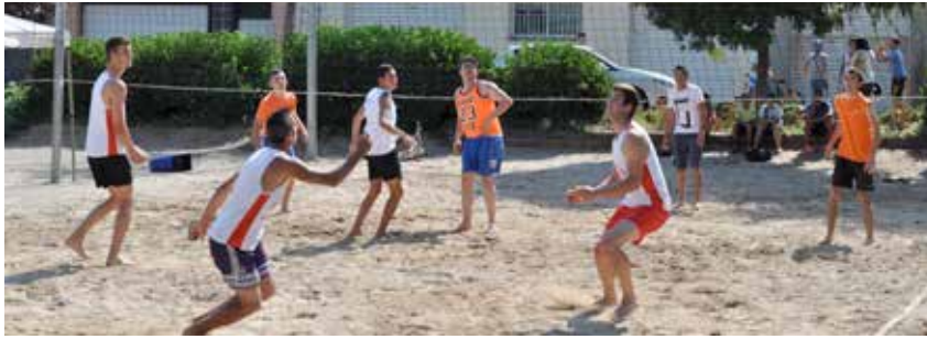
UN DELS PARTITS DEL CAMPIONAT ORGANITZAT PER L'ASSOCIACIÓ JUVENIL CAL 18

Vuit equips de la Pobla, la Torre, Masquefa, Capellades, Vilanova i Igualada van participar, el divendres 12 i el dissabte 13 de