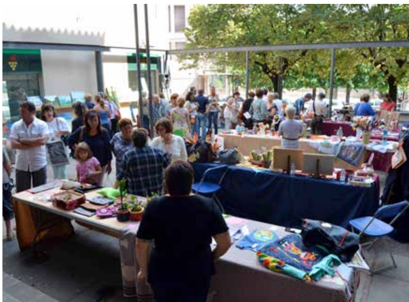
ELS CARRERS DEL NUCLI ANTIC VAN TORNAR A OMLIR-SE DE PINTORS, ARTESANS I NOMBROSOS VISITANTS