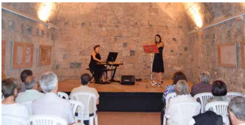
LA FORMACIÓ FLAUTOPIA VA OFERIR UN SORPRENENT CONCERT AL CASTELL

Faure i Debussy, i va transportar els assistents a l'entorn màgic de la capital francesa de vora el 1900. Al llarg de