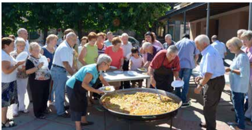
UNA ARROSSADA VA ESTRENAR EL NOU CURS DE L'ASSOCIACIÓ PER A L'OCI DE LA GENT GRAN

L'Associació per a l'Oci de la Gent Gran va iniciar el nou curs 2013-2014 amb un ampli ventall de propostes. El programa, organitzat per l'entitat amb la