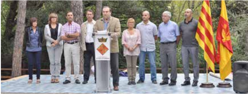
LECTURA DEL DISCURS INSTITUCIONAL EN COMMEMORACIÓ DE L'ONZE DE SETEMBRE

La Diada Nacional de Catalunya es va celebrar a la Pobla de Claramunt al Parc del Mil·lenari, en una matinal reivindicativa i al mateix temps festiva. El Consistori va voler posar el seu granet de sorra a un Onze de Setembre marcat per la històrica i multitudinària Via Catalana que va travessar Catalunya de nord a sud.