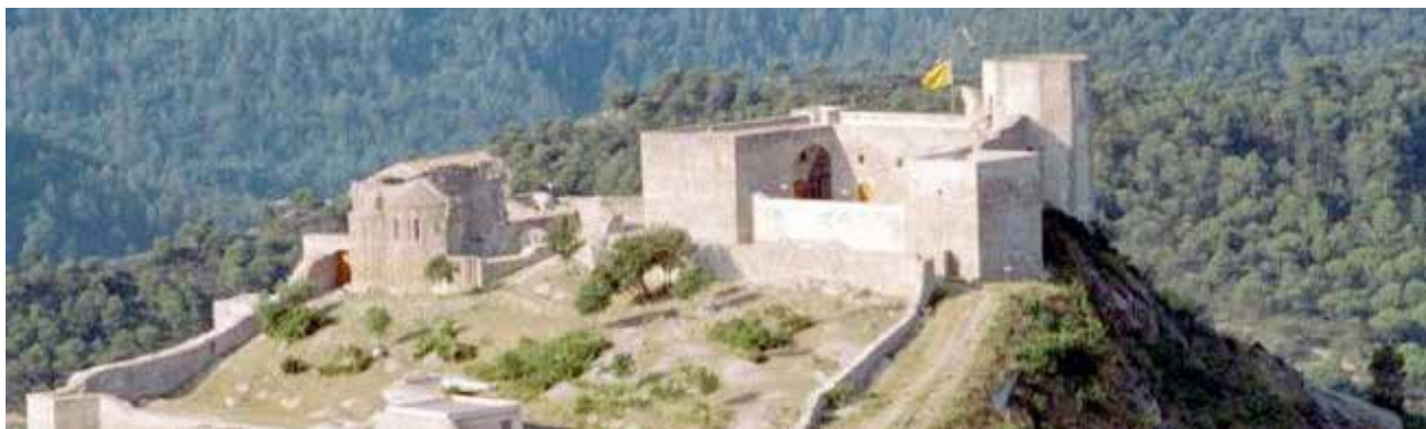
UNA IMATGE DEL CASTELL DE CLARAMUNT, A LA POBLA

El Castell de Claramunt va ser un dels béns monumentals que es van poder visitar el darrer cap de setmana de setembre, en el marc de les Jornades Europees del Patrimoni (JEP).