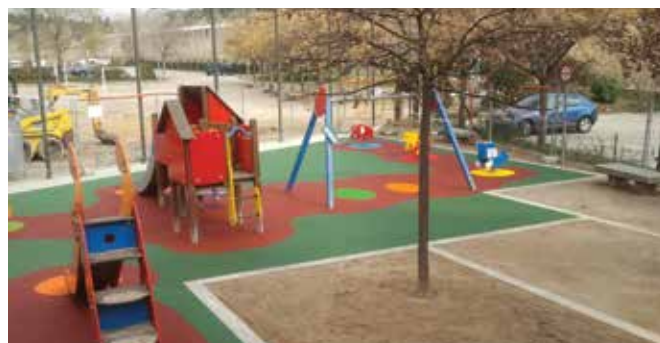
PARC DE SANT GALDERIC

pla d'inversions que l'equip de govern està executant a les Garrigues des de 2006, quan va prendre el compromís de repercutir part de l'IBI que s'hi recapta en millores urbanístiques al barri. Des d'aleshores s'han arranjat diversos carrers, s'ha habilitat una franja perimetral de seguretat contra incendis, s'ha construït un parc infantil, i s'ha fet un nou enllumenat en l'accés al barri. En properes fases s'arreglaran més carrers.