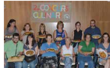
PARTICIPANTS EN EL CONCURS DE TRUITES

D'altra banda, el dissabte 5 d'octubre, l'Associació Juvenil Cal 18, amb la col·laboració de l'Ajuntament i l'empresa Plus Arts, també va organitzar tota una jornada lúdica dedicada als més petits, al parc de Sant Galderic. Desenes d'infants van combinar les dues possibilitats d'oci que s'oferien en aquest espai. D'una banda, Animalia, la recreació d'una selva, amb proves d'equilibri i destresa. D'altra banda, els Divertixocs,