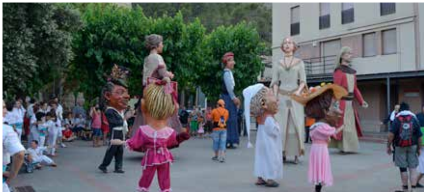
LA CERCAVILA VA SER UNA DE LES ACTIVITATS MÉS PARTICIPADES DE LA FESTA MAJOR

La Festa Major va omplir aquest estiu cinc intensos dies de juliol. La bona participació va ser la nota més destacada d'una programació que va seguir l'esquema d'èxit de les darreres edicions, al qual va incorporar novetats com un taller de falcons, gegants i capgrossos.