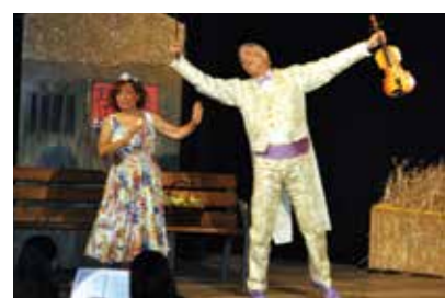
REPRESENTACIÓ DE L'ORIGINAL ESPECTACLE D'ÒPERA CÒMICA

d'octubre, va reunir 120 persones de totes les edats, un èxit d'assistència. Aquesta òpera còmica, escrita per Jacques Offenbach, reprèn el fil de la història tràgica d'Orfeu i Eurídice però hi posa notes d'humor. El format de la companyia anomenada va fascinar el públic per l'amenitat de la peça i el contingut de comèdia.