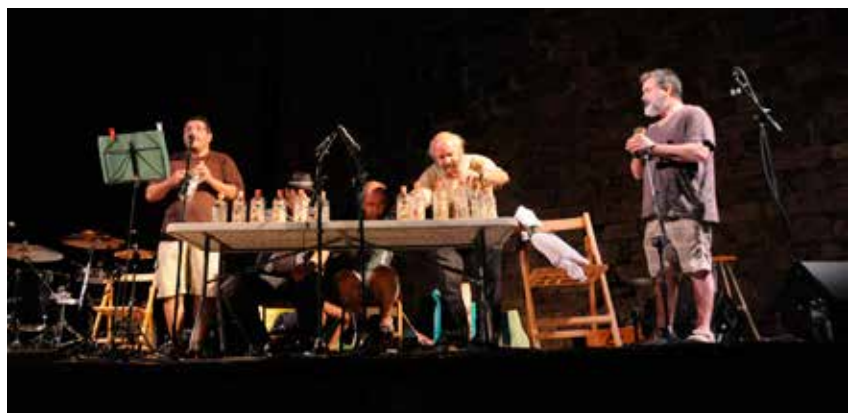
ELS MONOS DE LA POBLA, DURANT EL CONCURS DE SONADORS D'AMPOLLA D'ANÍS

Per finalitzar el festival, Marsupialis va desgranar les diferents danses que al llarg de dos anys d'estudi han recuperat dels