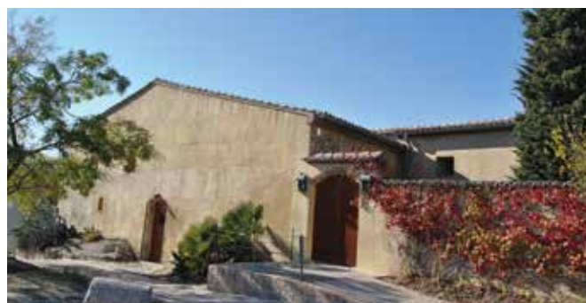
MILLORES A CAN GALAN

L'Ajuntament també ha construït un nou parc infantil al costat de les escoles, actuació que ha tingut un pressupost de 4.997,91 euros i l'ha dut a terme la brigada municipal. A més, ha fet millores al parc infantil de Sant Galderic, on s'ha redistribuït el mobiliari lúdic i s'ha posat un nou terra de cautxú, un material tou que evita que els infants es facin mal en cas de caigudes. La inversió ha estat de 18.896 euros, i els treballs els ha executat el Taller Àuria.