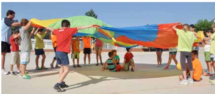
EL CASAL D'ESTIU VA TENIR UNA BONA PARTICIPACIÓ

Aquest estiu els infants de la Poble van tenir l'oportunitat de combinar l'esport, el lleure i la descoberta de l'entorn gràcies a una nova edició del Casal d'Estiu, del qual se'n van fer dues sessions: del 25 de juny al 26 de juliol, i del 2 al 10 de