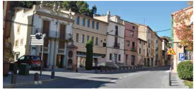
ADEQUACIÓ DE LA TRAVESSERA DE LA C-224

Una altra inversió prevista properament és la construcció, en dues fases diferents, de dues passereres per a vianants sobre el riu Anoia. Una, es construirà sobre la que actualment ja hi ha a la zona de la palanca, darrere de l'Ajuntament, i l'altra es farà al costat de l'accés del pas blau. Amb aquests nous accessos, es millorarà la connexió a peu entre el barri de les Cases Noves i el barri de can Galán. El projecte té un pressupost total de 228.679,21 euros i es finançarà totalment amb una subvenció de la Diputació.