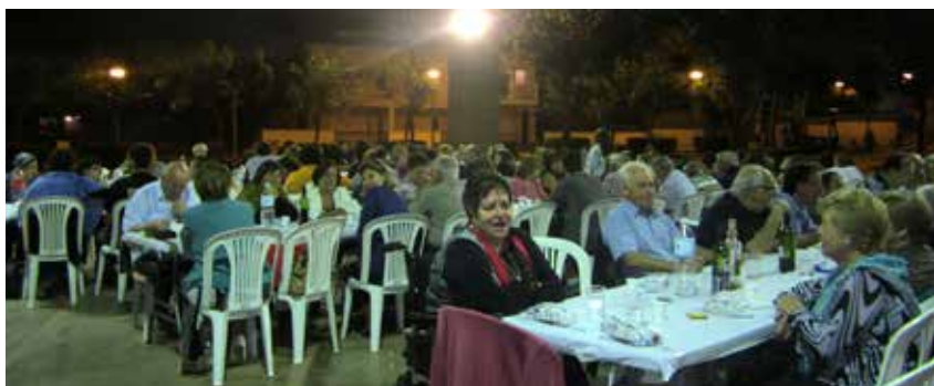
SOPAR DE LA SETMANA DE LA JOVENTUT

L'entitat local Barrufet Roig, amb la col·laboració de l'Ajuntament, va organitzar al juny l'onzena Setmana de la Joventut, un format que ha anat consolidant-se amb un gran èxit de públic. Enguany, els actes més participats van ser el concert i el sopar i el bingo.