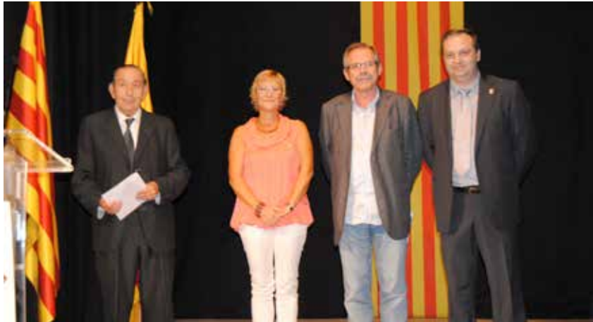
ACTE DEL LLIURAMENT DEL PREMI GUMERSIND BISBAL, A L'ATENEU