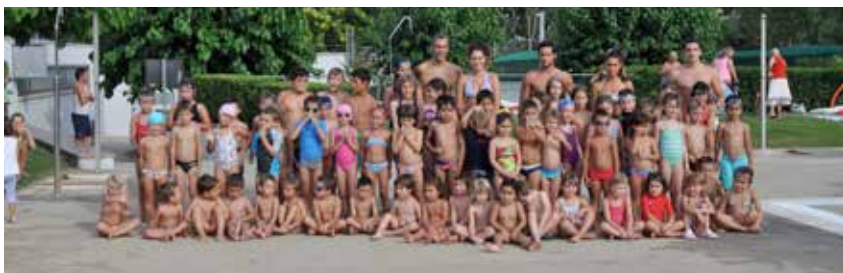
FOTO DE FAMÍLIA DELS CURSETS

Seixanta-cinc infants, d'entre 3 i 12 anys, van prendre part aquest estiu en els cursets de natació organitzats per la regidoria d'Esports. Els cursets es van