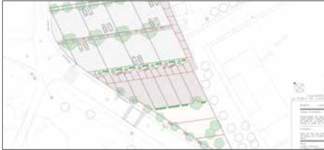
CAMÍ DE LA RIERA I CAMP DE FUTBOL

les existents, arranjar el voladís i refer les canals de recollida d'aigües pluvials. A més, es van reparar algunes esquerdes en les parets de la masia, la qual es va rehabilitar fa més de 20 anys, i en l'actualitat, acull diversos serveis municipals. Els treballs s'han finançat íntegrament amb recursos municipals, i els va executar l'empresa Construccions Munta SL.