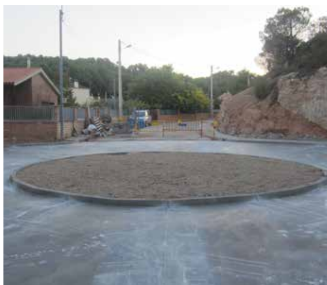
NOVA ROTONDA AL BARRI DE LES GARRIGUES

L'equip de govern municipal continua la transformació urbanística engegada els darrers anys amb nous projectes que contribueixen a millorar la qualitat de vida dels veïns i a fer de la pobla un municipi endreçat i agradable de viure-hi. Aquests darrers mesos s'han fet realitat diverses inversions, i durant els dos anys que queden de mandat es duran a terme altres projectes prioritaris. El bon estat de salut de les arques municipals, i les subvencions que s'han aconseguit, permetran fer aquest esforç inversor malgrat el complex escenari econòmic global.