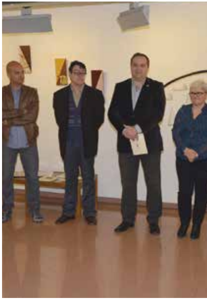
EXPOSICIÓ "LES DANSES", DE CARMÉ GONZÁLEZ