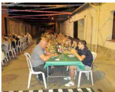
ELS VEÏNS VAN GAUDIR D'UN SOPAR

L'Associació de Veïns del barri de les Cases Noves va celebrar el 27 de juliol una lluïda festa amb motiu de Sant Jaume. Organitzada per l'associació de veïns, amb la col·laboració de l'Ajuntament, la celebració, que arribava a la 21a edició, va reunir fins a 150 persones, entre veïns, familiars i amics. A més, aquest any hi va haver una novetat destacada: una doble exhibició de balls de saló i de