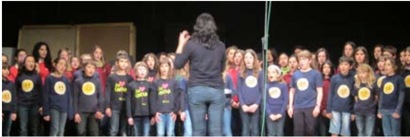
AL CONCERT HI VAN PARTICIPAR VUIT CORALS DEL PENEDÈS, ANOIA I GARRAF

L'Ateneu va acollir, el diumenge 28 d'abril, una Trobada de Corals Infantils del Penedès, Anoia i Garraf. L'activitat, que va organitzar el Secretariat de Corals Infantils de Catalunya, s'havia de fer al Castell de Claramunt però la pluja ho va impedir.