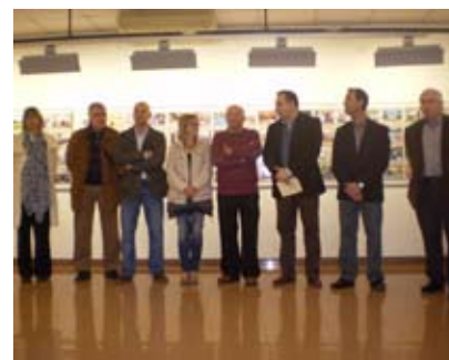
INAUGURACIÓ DE L'EXPOSICIÓ DE L'ARXIU FOTOGRÀFIC MUNICIPAL

Aquesta exposició la va organitzar la regidoria de Cultura. Actualment, l'Arxiu Fotogràfic Municipal compta amb un fons