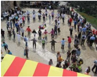
BALLADA DE SARDANES A LA PLAÇA DEL CASTELL

Després d'uns dies de pluja, el dimecres 1 de maig va brillar el sol. Aquest fet va animar la gent a pujar fins al Castell de Claramunt i participar en el tradicio-