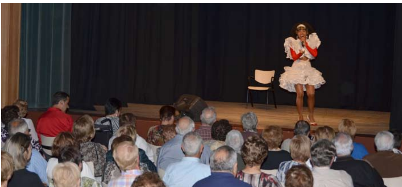
ESPECTACLE AMB LA CONEGUDA REGINA DO SANTOS