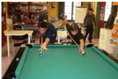
PARTICIPANTS AL CAMPIONAT DE BILLAR

La regidoria de Joventut, a través del Cau Jove, ja té a punt la programació d'activitats per al mes de juliol. Un campionat de futbol, un taller de xocoteràpia o una sortida a Illa Fantasia són algunes de les propostes en què