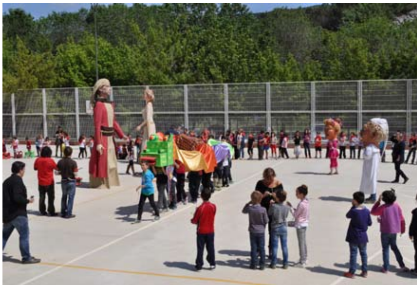
CERCAVILA AMB ELS GEGANTS I ELS CAPGROSSOS I LA CUCA FERA

L'escola del nostre poble va centrar la Setmana de l'Eix, del 13 al 17 de maig, en les festes i tradicions catalanes. Durant aquests cinc dies, els alumnes van participar en diferents activitats i tallers, com aprendre a jugar a la xarranca, a construir diversos instruments o a elaborar menjars.