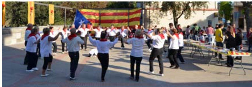
LA PLAÇA DE L'AJUNTAMENT VA ACOLLIR DIVERSES ACTIVITATS RELACIONADES AMB SANT JORDI