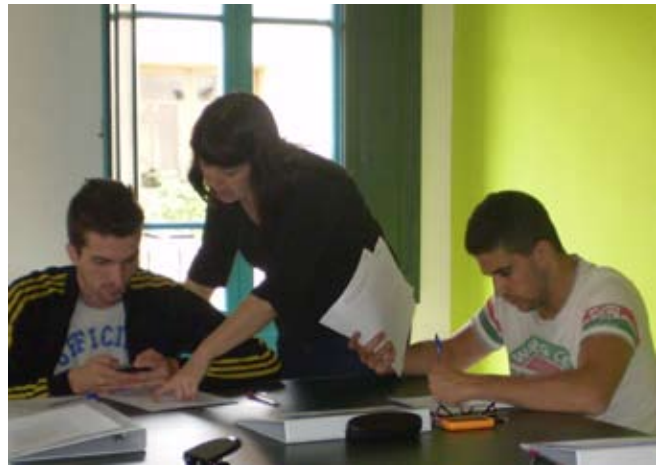
UNA DE LES SESSIONS REALITZADES AL CAU JOVE PER A NOIS I NOIES D'ENTRE 16 I 25 ANYS.

El Servei d'Orientació Laboral de la Pobla de Claramunt va obrir les portes a final de la dècada dels 90. Els primers anys va estar ubicat a la masia de can Galan i va ser un dels pioners de la comarca, juntament amb els d'Igualada, Vilanova del Camí i Santa