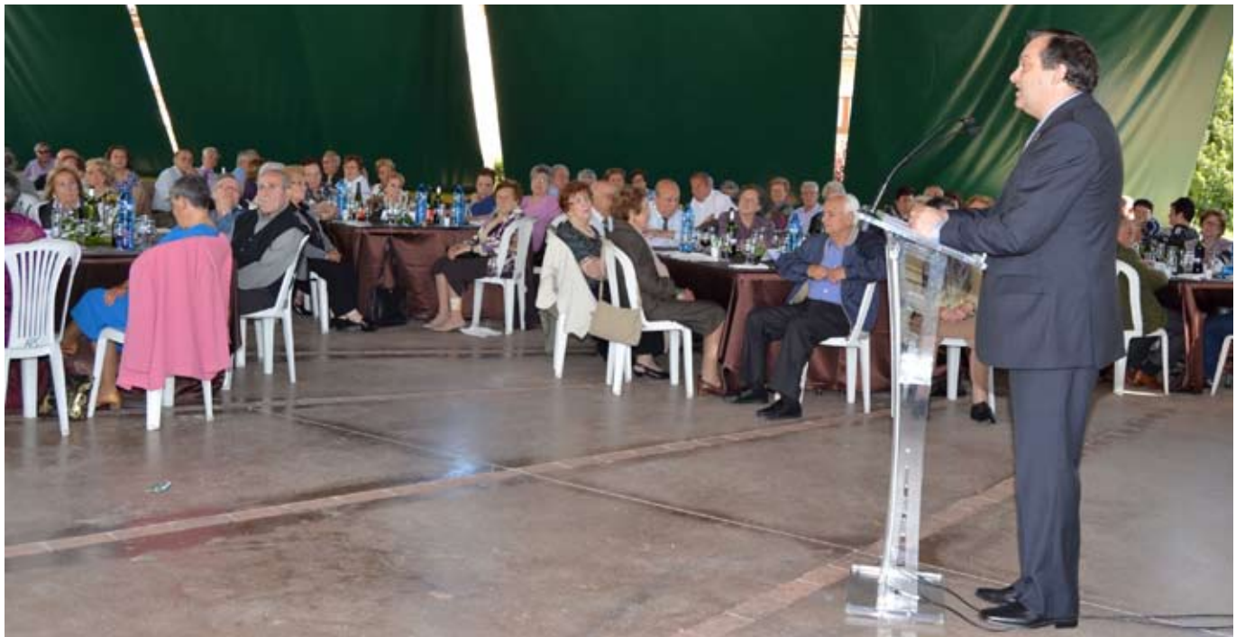
PARLAMENT DE L'ALCALDE DURANT EL DINAR DE CLOENDA, QUE VA APLEGAR UNES 200 PERSONES