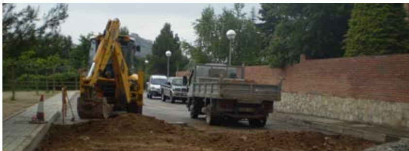
OBRES DE MILLORA AL CARRER DE LES MORERES DEL XARÓ

Des de fa uns mesos l'Ajuntament està realitzant diverses obres d'arranjament als carrers dels barris del Xaró, can Galan i l'Estació. En concret, aquestes intervencions afecten els vials i les voreres i s'inclouen en el projecte de l'equip de govern d'anar fent millores en les diverses zones del poble.