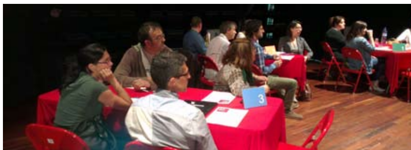
SESSIÓ DE TREBALL DE LA INICIATIVA "SI NO TINC FEINA ME LA INVENTO"

En el marc de col·laboració entre els ajuntaments de la Pobla de Claramunt, Vilanova del Camí i Òdena en temes industrials i laborals, es va tirar endavant el projecte "Si no tinc feina me la invento", adreçat a les persones en situació d'atur i per posar en comú les seves capacitats i habilitats. La sessió de treball es va fer el dijous 6 de juny a can Papasseit, a Vilanova del Camí, i hi van participar 21 persones, tres de les quals eren de la Pobla.