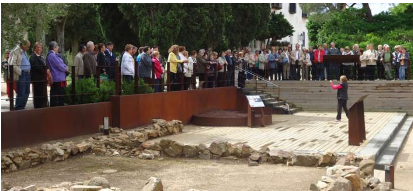
EXCURSIÓ A CALELLA DE PALAFRUGELL

La XIV Setmana de la Gent Gran es va organitzar des de la regidoria de Benestar Social. Hi van col·laborar l'Associació per a l'Oci de la Gent Gran, l'escola Maria Borés, el Cau Jove i pares i avis del municipi.