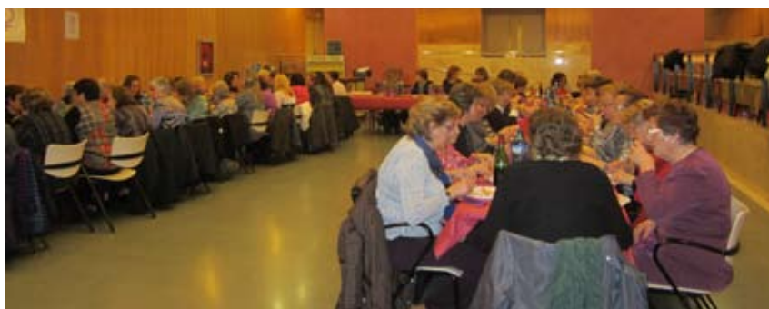
EL SOPAR AMB MOTIU DEL DIA INTERNACIONAL DE LA DONA ES VA FER AL LOCAL DE LATENEU

ternacional de la Dona. Aquesta activitat la va organitzar la regidoria de Benestar Social i va comptar amb la companyia de l'actriu poblatana Esther Bové. Abans de començar l'àpat, la regidora de