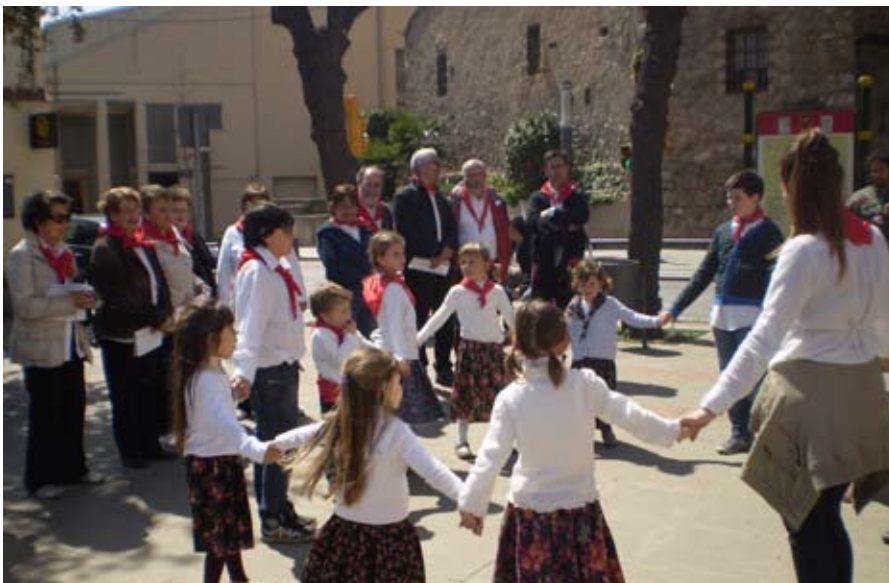
CANTADA DE CAMELLES A LA PLAÇA DE L'AJUNTAMENT

Els cantaires van fer cantades a diferents barris del poble, com can Galan, les Cases Noves, Sant Andreu, les Figueres o Sant Procopi. També van oferir una cantada a l'església de Santa Maria i a la plaça de