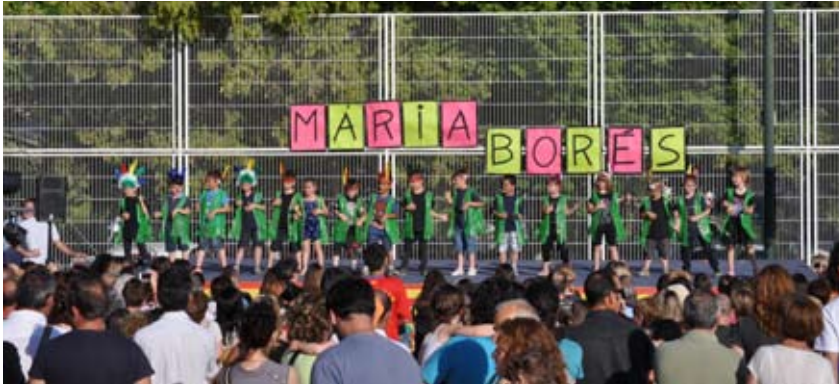
ACTUACIÓ DELS ALUMNES DURANT LA FESTA DE FI DE CURS

L'escola Maria Borés va dir adéu, el dissabte 15 de juny, al curs 2012-2013 amb una festa, que va tenir molt bona participació. Les activitats les van organitzar la plantilla de mestres del centre, l'Associació de Mares i Pares d'Alumnes (AMPA), amb la col·laboració de l'Ajuntament. L'actuació que van oferir els nens i nenes o el sopar de sarró són dues de les propostes que cal destacar d'aquesta jornada festiva.