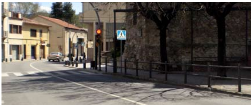
LA CARRETERA C-244 AL SEU PAS PEL CENTRE DEL POBLE

Des del carrer de Sant Procopi fins a l'avinguda de Catalunya es proposa la ubicació de cinc nous passos de vianants a diferents punts. Al carrer de Sant Procopi se situarien a la sortida del parc de l'Estrassa i davant de l'aparcament municipal, més avall de l'entrada del carrer de la Pedrera. I a l'avinguda de Catalunya es col·locarien