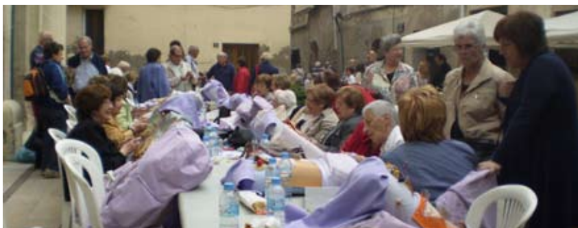
GRUP DE PUNTAIRES POBLATANES, DURANT LA TROBADA

El segon cap de setmana de juny el nostre municipi va acollir la XIII Trobada de Puntaires, en què van participar unes 200 dones. Un dia abans, i com altres anys, a la Sala Municipal d'Exposicions es va inaugurar una mostra de manualitats i puntes al coixí.