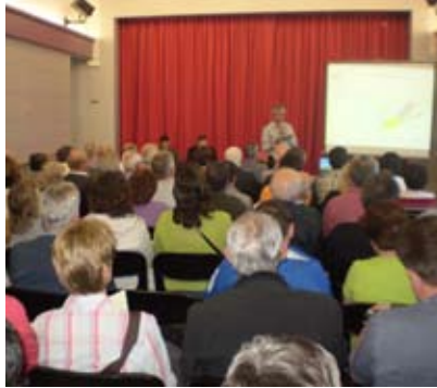
LA XERRADA VA TENIR LLOC AL TEATRE JARDÍ

L'associació es va crear el juny de 2010 i agrupa deu municipis: Bellprat, Sant