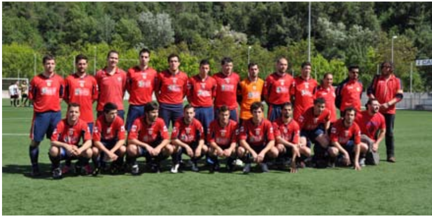
L'EQUIP AMATEUR QUE HA ACONSEGUIT L'ASCENS DE CATEGORIA

Malauradament s'ha acabat la temporada de futbol. Per a alguns això és senyal de l'arribada de l'estiu i per a d'altres és un alliberament del compromís continuat dels nens a participar, setmanalment, en les activitats futbolístiques. Pel que fa al nostre club ha estat una temporada amb sentiments una mica contraposats. Per una banda l'equip amateur ha assolit un ascens brillant després de quedar segon a la seva lliga regular i de jugar una esplèndida promoció i, per tant, la temporada vinent veurem l'equip competint en una categoria, la tercera catalana, que no hauria d'haver deixat.