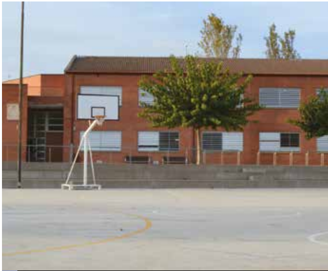
+ Es canviarà l'enllumenat de l'escola Maria Borés