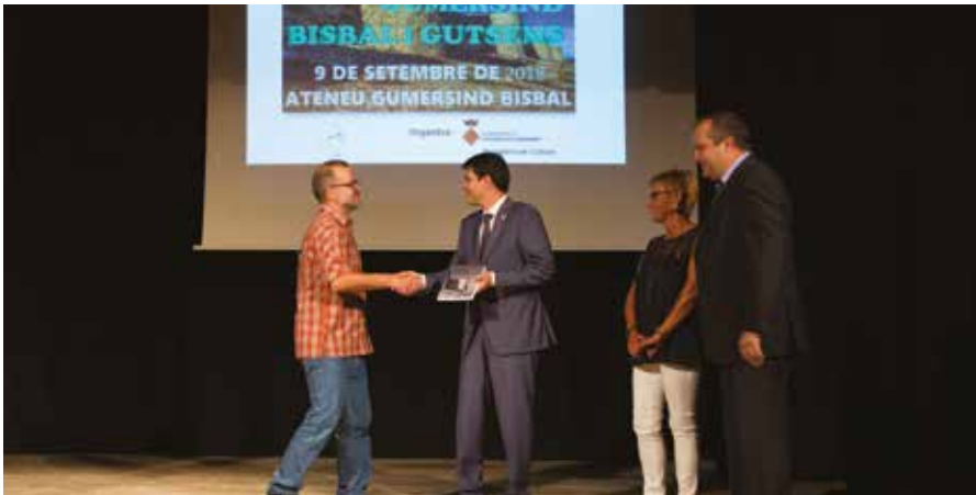
Moment del lliurament del llibre a l'autor