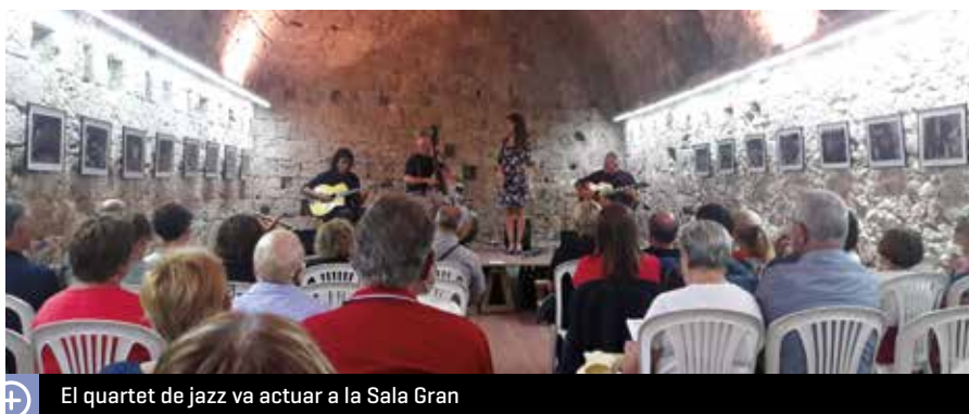
El quartet de jazz va actuar a la Sala Gran

El quartet Scaramouche va oferir, el dissabte 15 de setembre a la nit, un concert a l'entorn privilegiat del Castell de Claramunt. L'audició, organitzada per la Regidoria de Cultura, estava inclosa dins del cicle de la Fundació Castells Culturals de Catalunya i de la programació de les Festes Culturals.