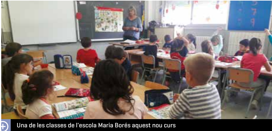
Una de les classes de l'escola Maria Borés aquest nou curs

La Llar d'Infants Municipal Sol Solet i l'escola Maria Borés van iniciar, el mes de setembre, el curs 2018-2019. Al primer centre educatiu les classes van començar el 17 de setembre, amb 23 nens i nenes i cinc educadores, i finalitzaran el 12 de juliol. I al segon, el curs va començar el 12 de setembre, amb 209 alumnes i 18 mestres, i finalitzarà el 21 de juny.