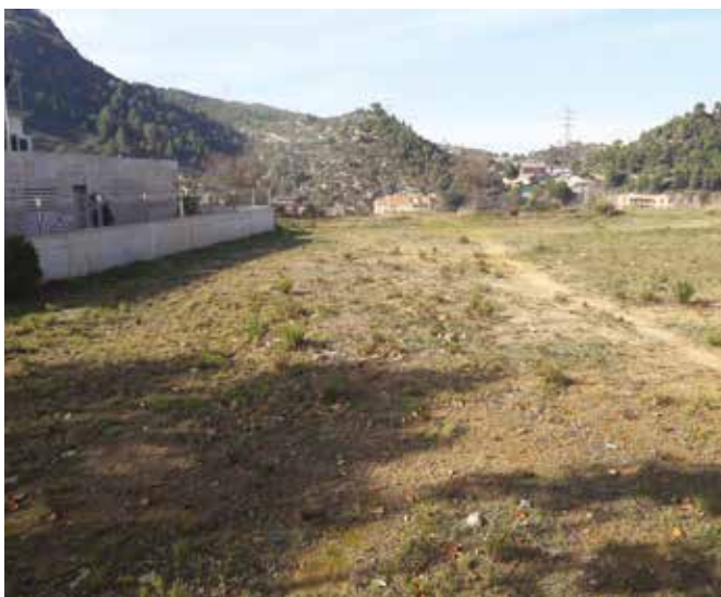
+ Terrenys on es construirà una pista per a monopatinis