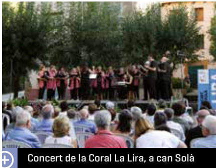
Concert de la Coral La Lira, a can Solà

La Coral La Lira, dins dels actes de commemoració del centenari del seu naixement, ha ofert els mesos de setembre i octubre diverses actuacions en barris del poble. A més d'aquestes cantades, la formació vocal també va participar a la setena Mostra de Cors de Clavé, que va tenir lloc a l'Auditori de Barcelona el diumenge 14 d'octubre.