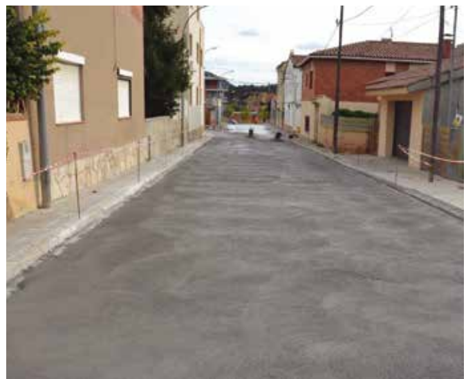
+ Arranjament del paviment del carrer de Santiago Rusiñol

escales de fusta i paviment de formigó. L'accessibilitat plana està garantida pel parc anterior a la llar d'infants i per darre-re d'aquest edifici. L'actuació té un pressupost de 49.287,22 € [IVA inclòs] i es finançarà amb fons municipals. L'aprovació inicial del projecte va comptar amb els vots a favor del PDeCAT i Junts per la Pobla i l'abstenció de Participa! i ERC.