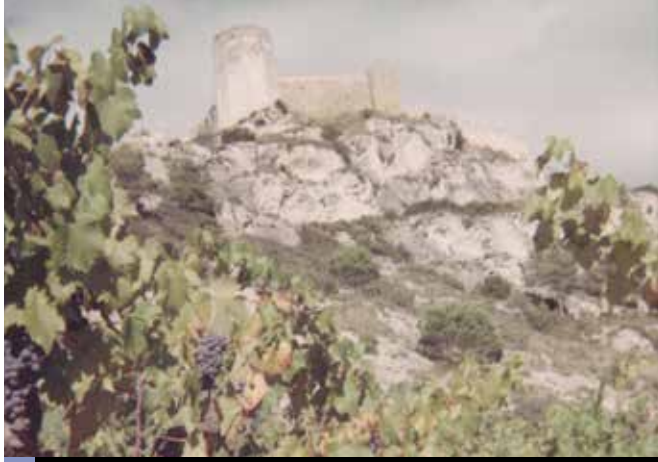
Els vessants del Castell de Claramunt van estar ben plantats de vinyes

El conreu dels ceps i la producció de vi van ser molt importants entre la segona meitat del segle XIX i la primera del segle XX, tot i que en aquesta darrera etapa ho van ser menys. Per tant, la celebració d'una festassa com la del Ball del Most per alegrar-se de les bones collites va estar ben justificada.