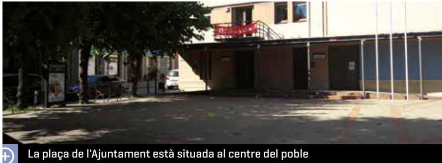
La plaça de l'Ajuntament està situada al centre del poble

El treball incorpora una diagnosi que descriu la situació de la qual parteix l'Ajuntament en matèria d'igualtat de gènere i un Pla d'Acció que proposa les accions per combatre situacions que puguin ser discriminatòries per motius de gènere. El pla l'ha impulsat l'Ajuntament, amb el suport de la Mancomunitat Intermunicipal de la Conca d'Òdena (MICOD) i l'ha portat a terme la Diputació de Barcelona que ha contractat la societat Amaltea Igualtat SCCL que l'ha redactat.