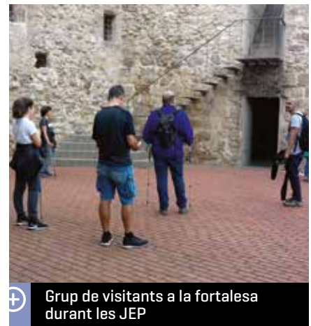
Grup de visitants a la fortalesa durant les JEP

de portes obertes i una visita guiada gratuïta. Les JEP són la festa del patrimoni i els diferents municipis i entitats organitzen un seguit d'activitats gratuïtes per a tots els públics: visites guiades, representacions teatrals, concerts, exposicions, etc. La iniciativa s'impulsa, cada any, des del Departament de Cultura de la Generalitat de Catalunya - Agència Catalana del Patrimoni Cultural, l'Institut Ramon Muntaner, la Federació de Municipis de Catalunya i l'Associació Catalana de Municipis.