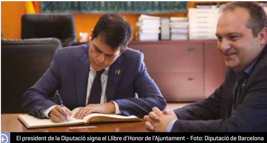
El president de la Diputació signa el Llibre d'Honor de l'Ajuntament