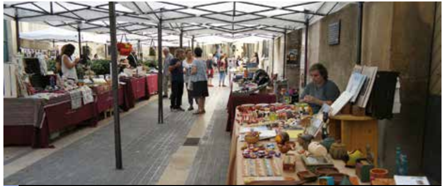
Parades a la plaça de l'Església

A la plaça de mossèn Pere Bosch (els Jardinetes), el visitant podia trobar les obres dels pintors i les pintores, a més d'una parada amb treballs fets de patchwork, espelmes i peces de roba, entre d'altres. A la plaça de l'Església, hi ha-