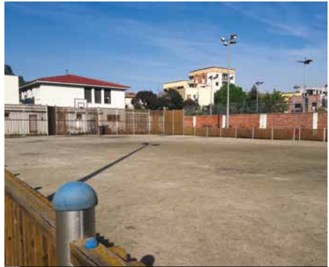
+ Espai on s'ubicaran les dues pistes de pàdel