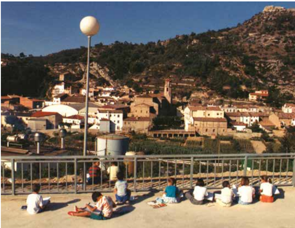
Participants al Concurs de Pintura Ràpida Infantil (1987)