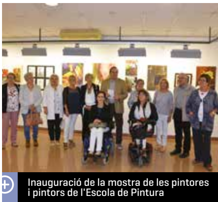
Inauguració de la mostra de les pintores i pintors de l'Escola de Pintura