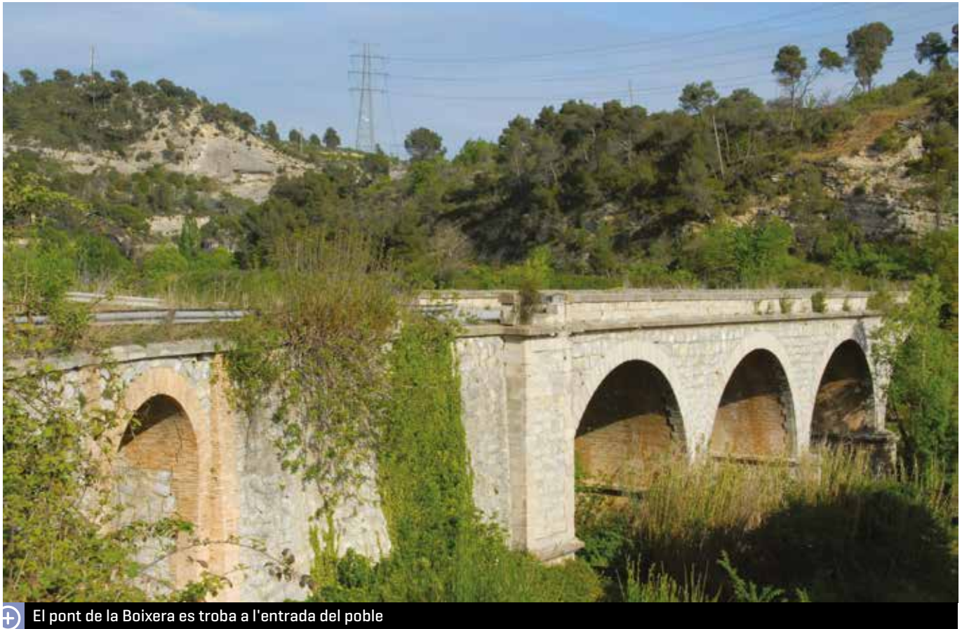
El pont de la Boixera es troba a l'entrada del poble