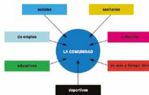
Figura 2: Els serveis i la comunitat

Per impulsar la salut comunitària s'ha de promoure la col·laboració i les aliances entre els diversos sectors del municipi, la societat civil, les entitats i els agents socials [Figura 2]. A part dels serveis sanitaris, els diferents recursos dels que disposa la comunitat permeten una visió global dels problemes que es detecten.