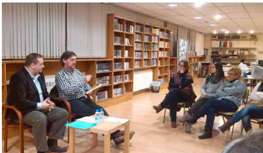
PRESENTACIÓ DEL CLUB DE LECTURA, A LA BIBLIOTECA MUNICIPAL

Per formar part d'aquest club caldrà fer una aportació econòmica. Les persones que estiguin interessades en aquesta iniciativa es poden adreçar a la biblioteca municipal, Tel. 93 808 84 45.