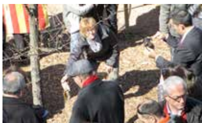
MOMENT EN QUÈ LA REGIDORA VA TIRAR LA TERRA AL ROURE

El nostre municipi va col·laborar en la plantada del Roure del Tricentenari, que es va fer, el diumenge 2 de març al matí a la muntanya de Montserrat, al costat de Santa Cecília. L'acte simbòlic el va presidir el conseller de la Presidència de la Generalitat de Catalunya, Francesc Homs. Aquest arbre es va plantar amb terres