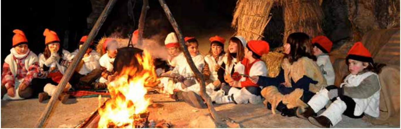
ESCENA DELS PASTORS DEL PESSEBRE VIVENT