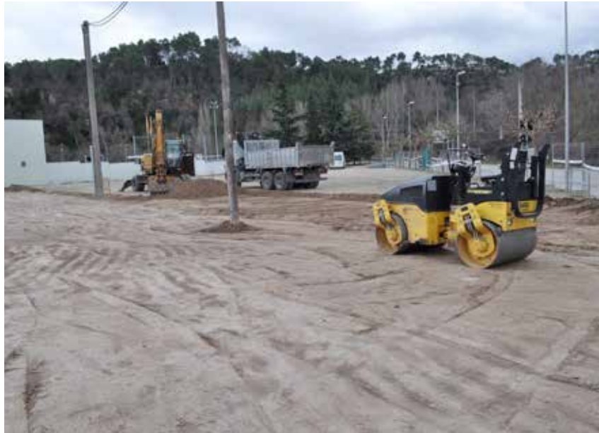
PRIMERS TREBALLS D'ARRANJAMENT DEL PÀRQUING DEL CAMP DE FUTBOL

Per tant, l'obra consisteix a arranjar els