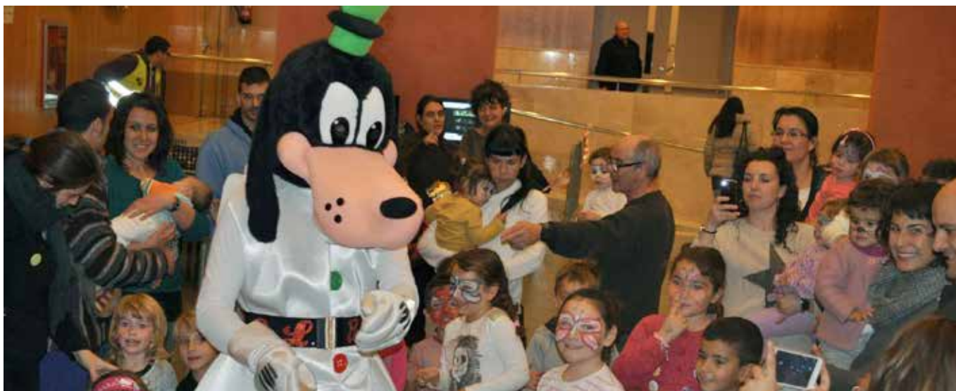
VISITA D'UNS DELS PERSONATGES DE DISNEY AL SALÓ DE LA INFÀNCIA