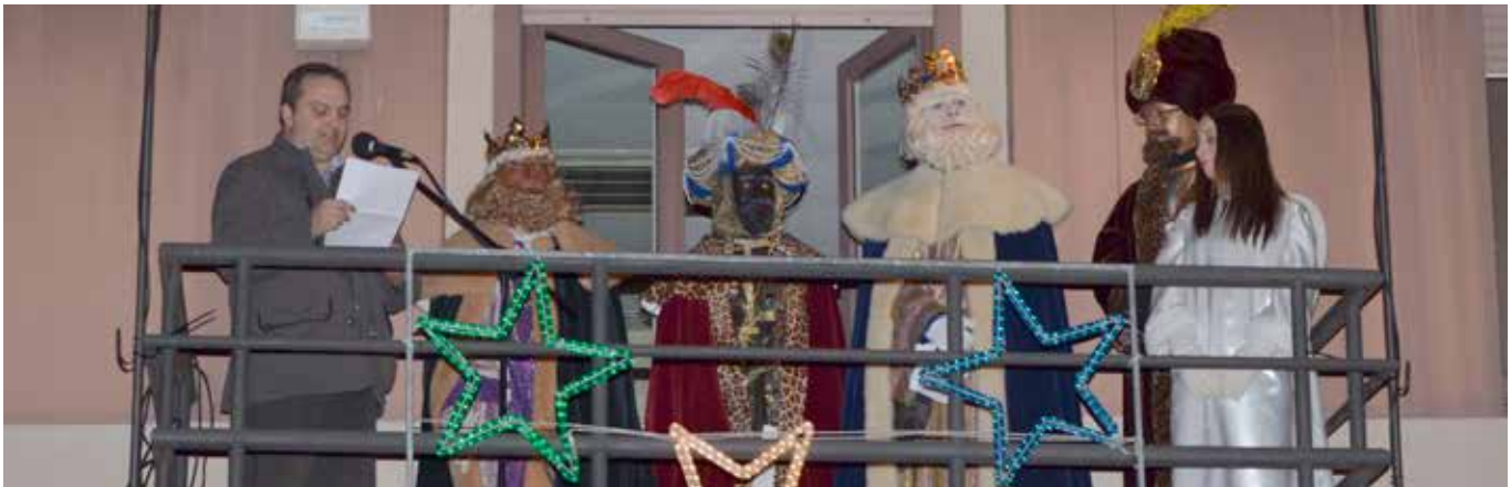
DISCURS DE L'ALCALDE EN EL MOMENT DE LA RECEPCIÓ DE SES MAJESTATS

vament com va anar l'activitat. Com a novetat i que va sorprendre el públic, cal destacar l'escena dels Dimonis, on hi havia uns àngels que cantaven rapejant.