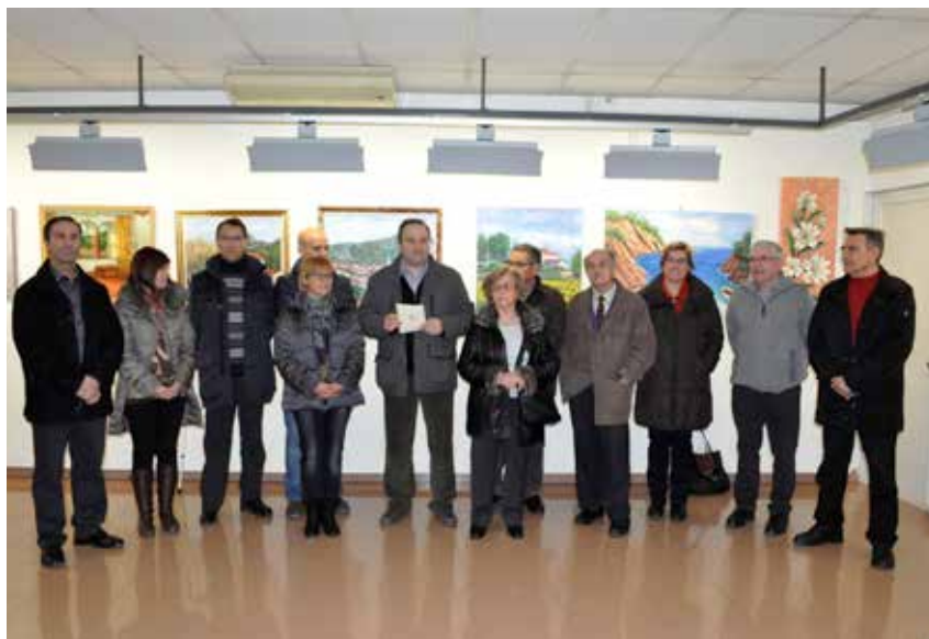
INAUGURACIÓ DE LA COL·LECTIVA DE PINTORS I PINTORES LOCALS