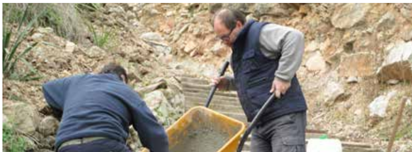
ACTUACIÓ DE MILLORA DE LES ESCALES DEL CASTELL DE CLARAMUNT

Davant la greu crisi econòmica que s'està patint, el 2013 el Consistori ja va tirar endavant uns plans ocupacionals interns, que van suposar la contractació de nou persones, també en períodes de tres mesos. Aquestes dues actuacions, promogudes per les regidories de Promoció Econòmica i de Benestar Social, formen part de les polítiques de l'equip govern per ajudar les persones i les famílies del