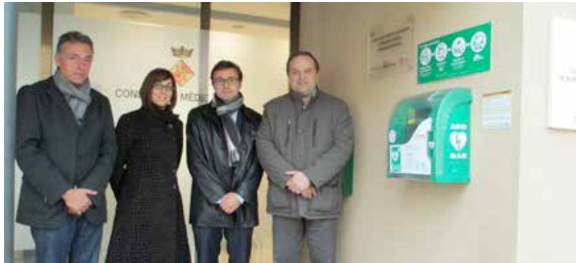
L'ALCALDE, LA REGIDORA DE SANITAT I REPRESENTANTS DE L'EMPRESA, EN EL MOMENT DE LA COL·LOCACIÓ DEL DESFIBRIL·LADOR

Des de principi de desembre hi ha instal·lat al Consultori un desfibril·lador extern automàtic (DEA) per tal de garantir la possibilitat de donar una resposta ràpida a les persones que pateixin una aturada cardíaca. La instal·lació de l'aparell va anar a càrrec de l'Ajuntament, a través de la regidoria de Sanitat, i la va realitzar l'empresa Espais Cardioprotectes