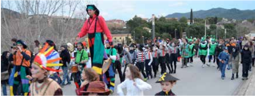
LA RUA ES VA FER PER DIVERSOS CARRERS DEL MUNICIPI