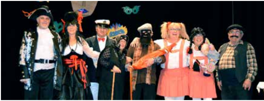
PARELLES GUANYADORES DEL CONCURS DE DISFRESSES DE L'ASSOCIACIÓ PER A L'OCI DE LA GENT GRAN

Els poblatans i les poblatanes van viure el primer cap de setmana de març la festa de Carnestoltes. El divendres 28 de febrer a la nit el Barrufet Roig va organitzar un concurs de disfresses i una discomòbil i el dissabte 1 de març a la tarda es va fer una rua per diversos carrers del municipi que va finalitzar a l'Ateneu Gumersind Bisbal.