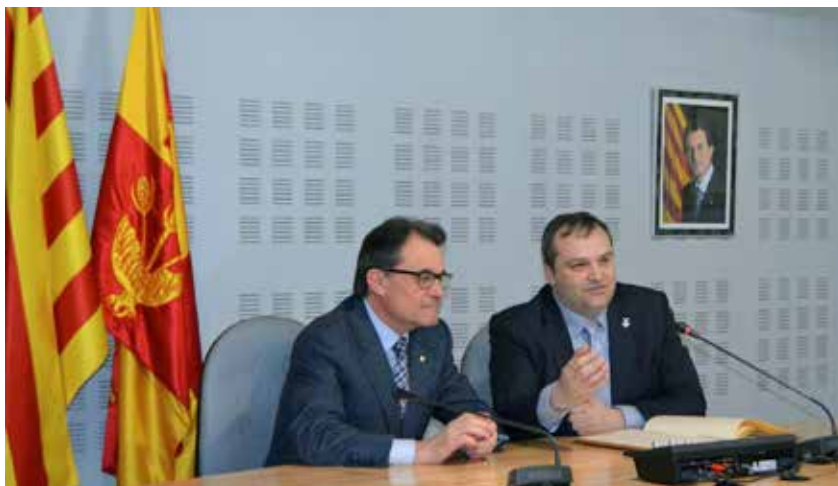
EL PRESIDENT DE LA GENERALITAT I L'ALCALDE, EN EL MOMENT DE LA SIGNATURA AL LLIBRE D'HONOR

El president va afegir que aquest aspecte social és molt important, però que no s'ha d'oblidar el relançament econòmic del país que és vital "per superar la crisi i ajudar la gent perquè surti d'aquesta situació tan vulnerable" . En aquest sentit, Mas va destacar que, actualment, Catalunya "té més inversió estrangera que en altres moments i l'any passat vam rebre quinze mi-