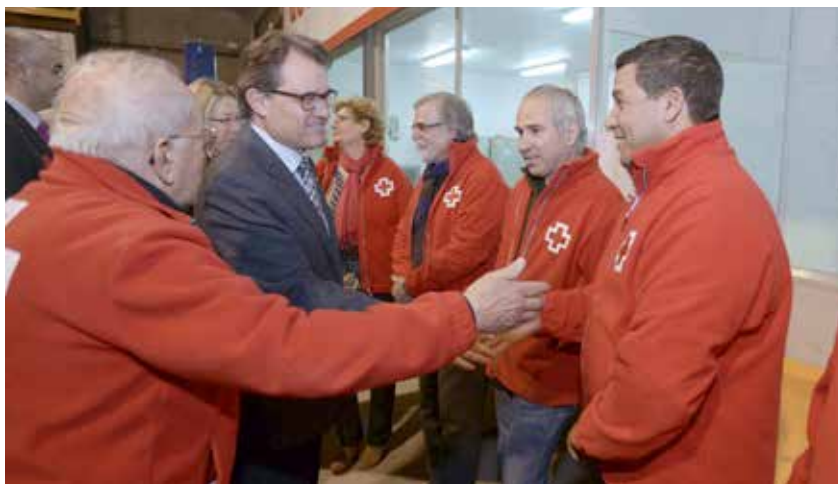
VISITA D'ARTUR MAS AL MAGATZEM DE LA CREU ROJA

lions i mig de turistes. Això vol dir que com a país som atractius" .