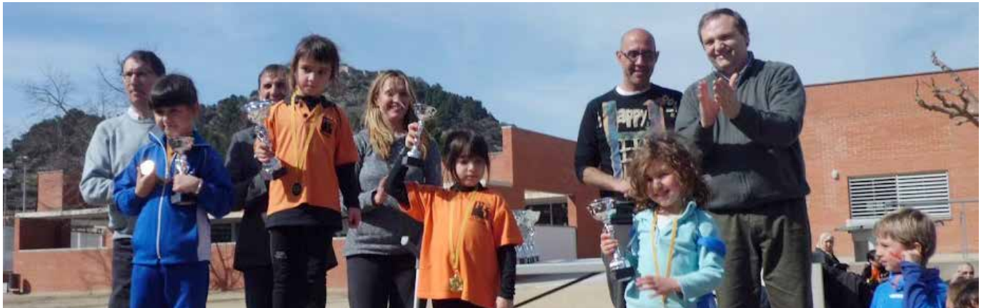
LLIURAMENT DE PREMIS DEL PRIMER CROS ESCOLAR

El primer Cros Escolar i Cursa Popular que es va organitzar al nostre municipi va tenir una molt bona acollida. Dos cents disset participants van córrer en aquesta competició que es va fer el diumenge 2 de març als voltants de l'escola Maria Borés i que van organitzar el centre, l'AMPA, el Consell Esportiu de l'Anoia amb la col·laboració de l'Ajuntament i el forn de pa i pastisseria Jordi. Dels més de 200 corredors, 82 eren del col·legi poblatà i 135 d'altres centres de l'Anoia, com els Maristes d'Igualada, el Joan Maragall de Vilanova del Camí o el Diví Pastor de Capellades. Hi havia vuit categories, masculí i femení, des de P3 fins a cadet. El recorregut era pels carrers del voltant del col·legi i anava des dels 100 metres per als participants de P3 fins als 2.750 metres per als cadets. A la cursa popular els corredors van haver de fer 2.200 metres.