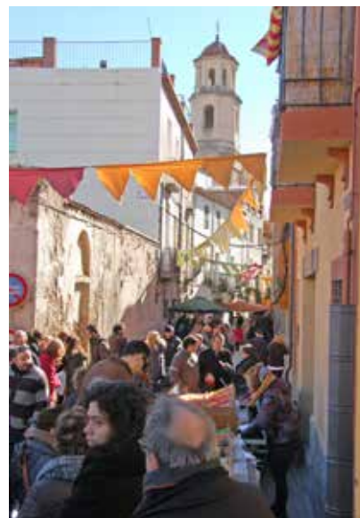
MERCAT DE PRODUCTES ARTESANALS, AL NUCLI ANTIC

Parades de formatges, d'olives, d'herbes remeieres, de bijuteria, entre d'altres productes artesanals van omplir, el diumenge 2 de febrer, amb motiu de la Fira de la Candelera, el nucli antic. Aquesta activitat, que va arribar a la sisena edició, la van organitzar la regidoria de Cultura i l'empresa Mapamundi Produccions que van fer una molt bona valoració del resultat d'aquesta iniciativa firal.