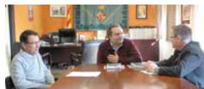
L'ALCALDE I EL REGIDOR D'EDUCACIÓ VAN REBRE EL DIRECTOR DELS SERVEIS TERRITORIALS D'ENSENYAMENT A L'AJUNTAMENT