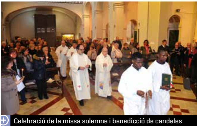
Celebració de la missa solemne i benedicció de candeles