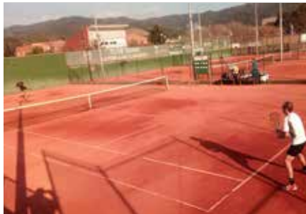
Un dels partits disputats dins del I Open Comarca d'Anoia

Més d'una setantena de tennistes participen, des de mitjan de febrer, a la primera edició de l'Open Comarca d'Anoia, organitzat pel Club Tennis la Pobla, i destinat a jugadors d'àmbit amateur. Els participants són de set clubs diferents,