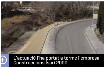
L'actuació l'ha portat a terme l'empresa Construccions Isari 2000

L'Ajuntament ha realitzat diverses millores per a la seguretat dels vianants a la corba de la carretera de la Rata. L'actuació l'ha portat a terme l'empresa Construccions Isari 2000 i ha tingut un cost de gairebé 5.000 €.