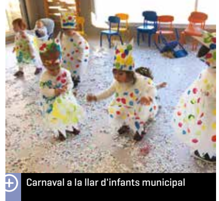
Carnaval a la llar d'infants municipal

hi va haver l'esperada pluja de confeti i de globus gegants. Es van tirar quaranta quilos de paperets i deu globus gegants.