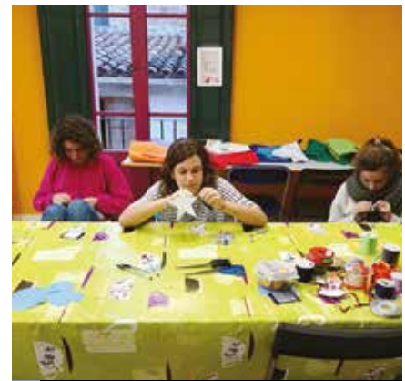
Joves que van participar al taller de clauers de feltre

Pel que fa als campionats, del 26 al 28 de març se n'organitzarà un de tennis taula. Les inscripcions, que són gratuïtes, es podran fer del 19 al 24 de març al Cau Jove. A més de totes aquestes