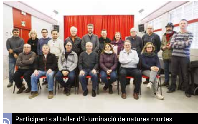
Participants al taller d'il·luminació de natures mortes

novetat, hi havia un agutzil, que recorria els carrers fent una crida de la festa i llegint un pregó. A l'entorn de l'antic safareig hi havia diferents objectes que recordaven com, antigament per la Candelera, es feia la bugada anual a les cases. Una altra novetat va ser que els visitants eren obsequiats amb un tiquet per posar una espelma a l'altar de la mare de Déu de la Llet.