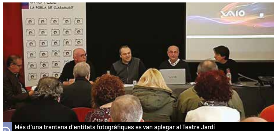
Més d'una trentena d'entitats fotogràfiques es van aplegar al Teatre Jardí

La Pobla de Claramunt va acollir, el dissabte 17 de febrer al matí, l'assemblea general ordinària de la Federació Catalana de Fotografia. La reunió va tenir lloc al Teatre Jardí i va aplegar una trentena d'entitats procedents de diferents punts de Catalunya. L'acte el va organitzar l'Agrupació Fotogràfica Castell de la Pobla.