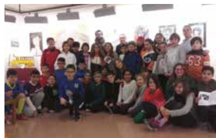
Un dels grups que va visitar l'espai d'exposicions

Els alumnes de cycle inicial i superior de l'escola Maria Borés van visitar, el dijous 8 de febrer, coincidint amb Dijous Llar-