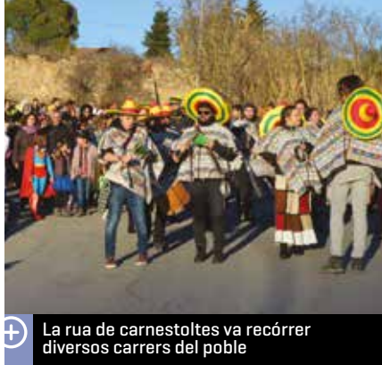
La rua de carnestoltes va recórrer diversos carrers del poble

La rua va recórrer diversos carrers del poble fins a l'Ateneu, on Els Bombollers encara van tocar una estona més. Després els nens i nenes disfressats van poder berenar. Es van repartir uns 200 bollicaos . Tot seguit, amb la música més actual i els ritmes de sempre del DJ Àlex,