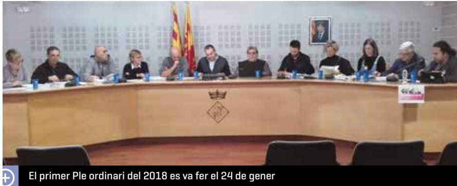
El primer Ple ordinari del 2018 es va fer el 24 de gener

Les entitats locals podran presentar fins al 20 d'abril les sol·licituds de subvencions per al 2018. Les peticions es podran presentar al registre d'entrada de l'Ajuntament, de dilluns a divendres, de les 8 del matí a les 3 del migdia, i els dimarts també de les 4 a 2/4 de 7 de la tarda.