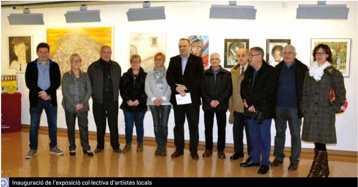
Inauguració de l'exposició col·lectiva d'artistes locals