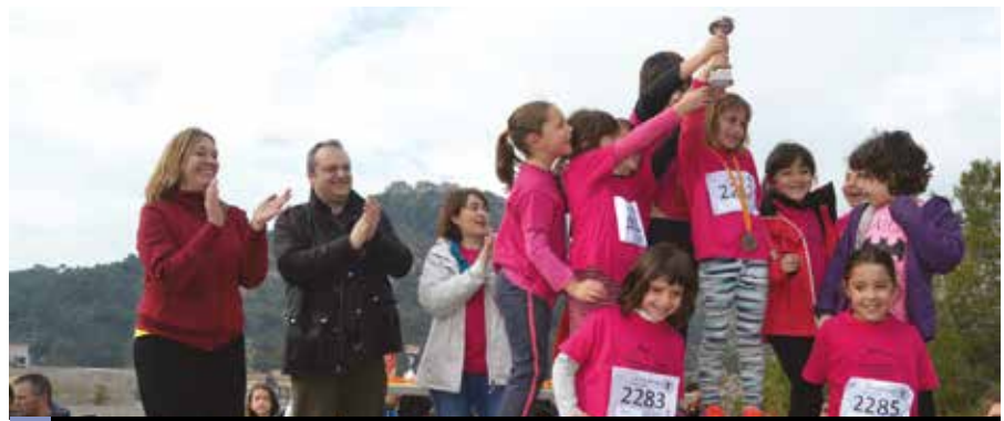
Liurament de premis del cinquè Cros Escolar

Des de l'Ajuntament volem felicitar els organitzadors d'aquesta activitat, que enguany va ser tot un èxit de participació.