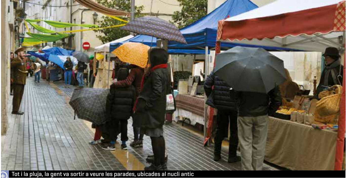
Tot i la pluja, la gent va sortir a veure les parades, ubicades al nucli antic