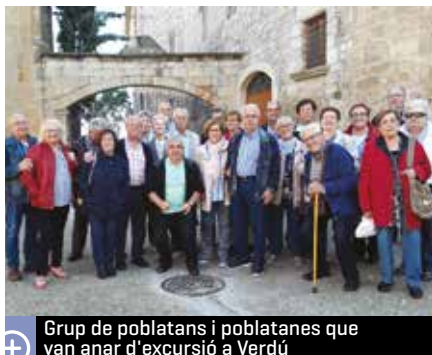
Grup de poblatans i poblatanes que van anar d'excursió a Verdú

Des del mes de setembre l'Associació per a l'Oci de la Gent Gran organitza un ampli ventall de propostes. Sortides, bingos o els balls dels diumenges a la tarda són algunes de les activitats que es porten a terme des d'aquesta entitat.