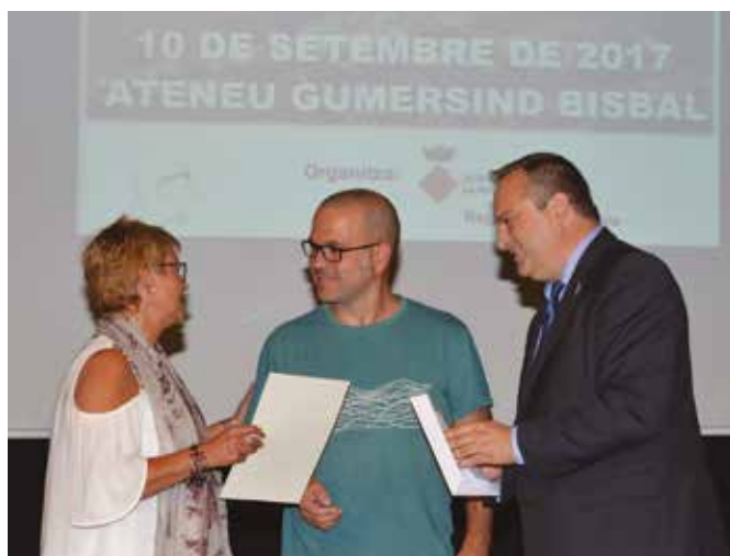
Moment del lliurament del Premi Gumersind Bisbal al guanyador de l'edició de l'any 2017

tesanal. Hi havia bijuteria, rebosteria, ceràmica, trencadís, joguines, bosses i moneders, fotografies, espelmes, objectes fets de patchwork, pintura, entre d'altres. També es podien trobar reproduccions de carros i calesses i maquetes fetes amb fusta de diferents racons emblemàtics del municipi i d'altres localitats, com les Tres Fonts o el Safareig Públic.