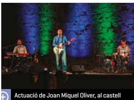
Actuació de Joan Miquel Oliver, al castell

El Castell de Claramunt va acollir, com cada any a mitjan de juliol, una nova edició de l'Anoia Folk, organitzada per l'Associació Cultural La Llobreia amb el suport de l'Ajuntament i la col·laboració de diverses empreses i establiments. En aquesta ocasió, es van aplegar a la fortalesa més de 400 persones que van gaudir de l'actuació de la formació 2princesesbarbudes i de