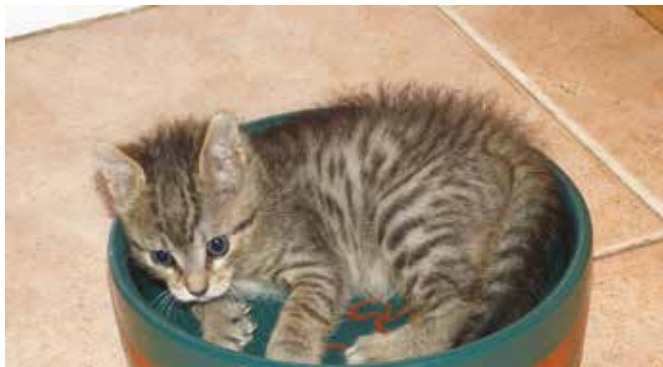
➤ Els gats entren en zel a partir de final de desembre, quan el dia s'allarga

L'esterilització és una actuació veterinària que aporta millores en la salut i el benestar dels animals, al mateix temps que millora la qualitat i la convivència que tenim amb ells. El control reproductiu també ajuda a combatre el problema de la superpoblació i situacions d'abandonament, propagació de malalties, etc.