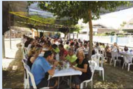
Més d'un centenar de persones van assistir a l'arrossada

A l'arrossada que es va fer el diumenge hi va haver més d'un centenar de comensals, que després de dinar van poder jugar al bingo. També cal destacar el sopar que es va fer el divendres, en què hi van assistir uns 150 veïns i