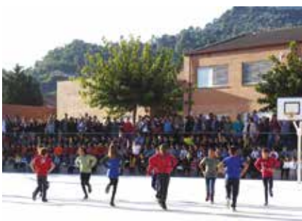
Mostra de cançons i danses tradicionals dels alumnes de l'escola

El mateix dimarts a la tarda, des del Cau Jove es va posar una parada de castanyes a la plaça de l'Ajuntament. Una des-