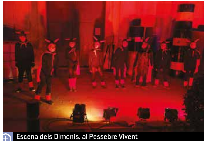
Escena dels Dimonis, al Pessebre Vivent

Quan passaven pocs minuts de 2/4 de 7 de la tarda, el pregoner, acompanyat d'una seixantena de patges, va arribar en tren a l'estació. Allà els esperaven un bon nombre de poblats i poblatanes, i els nens i nenes els van rebre amb fanallets. El pregoner va donar la benvinguda als Tres Reis, que van pujar pel pont de l'estació. En arribar, la quitxalla es va poder