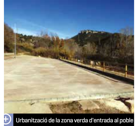
Urbanització de la zona verda d'entrada al poble

Especiales. L'actuació afecta un espai de 1.722 m 2 . Hi ha una part de plaça dura de formigó colorat i una part, tova de sauló. La banda més propera al riu s'ha protegit amb una barana de fusta tractada i al talús del costat de la carretera s'han col·locat uns gabions de pedra on hi haurà una zona d'enjardinament. S'ha instal·lat enllumenat i queda pendent la col·locació de mobiliari urbà i la vegetació. La intervenció, que ja ve de fa temps, suposa una important millora per als veïns de la zona.