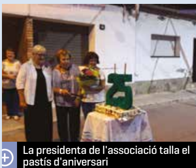
La presidenta de l'associació talla el pastís d'aniversari