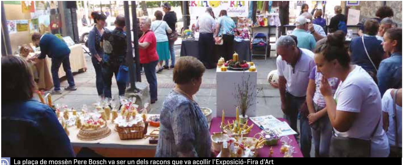
La plaça de mossèn Pere Bosch va ser un dels racons que va acollir l'Exposició-Fira d'Art