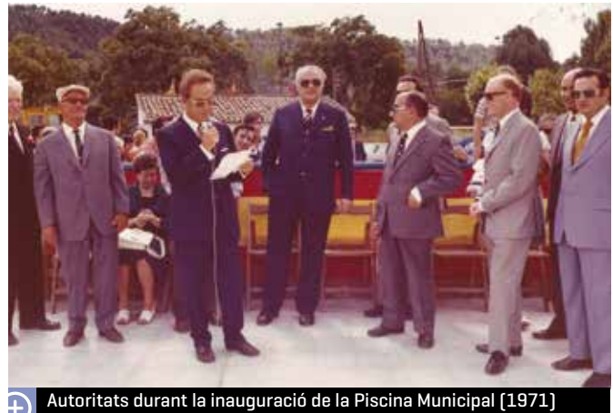
Autoritats durant la inauguració de la Piscina Municipal [1971]