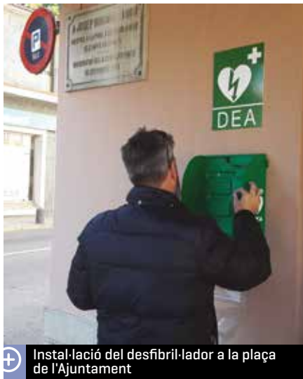
Instal·lació del desfibril·lador a la plaça de l'Ajuntament

Pel que a la taxa per a la prestació de serveis i la realització d'activitats d'interès general, s'afegeixen els preus de dos tallers que es fan nous aquest curs, que són ganxet i mitja i llenguatge musical i s'anul·la l'import que es cobrava per tenir el carnet de la biblioteca municipal.