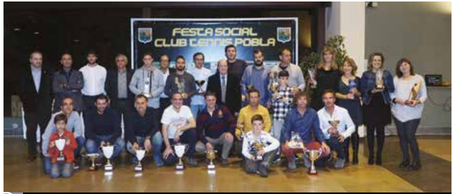
Grup de premiats dels diferents torneigs i autoritats, en el transcurs de la Festa Social