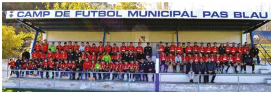
Presentació dels equips del CF la Pobla per a la temporada 2017 - 2018

Pel que fa als amateurs, en la dinovena jornada, l'últim cap de setmana de gener, se situaven en el dissetè lloc de la taula, amb 12 punts. La temporada passada els futbolistes poblatans van aconseguir