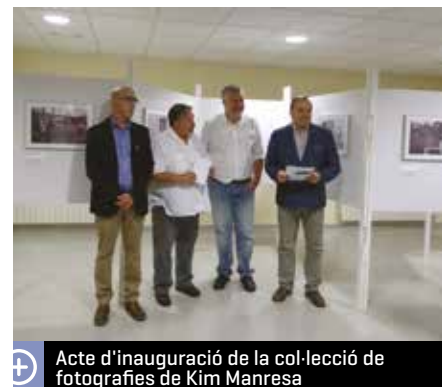
Acte d'inauguració de la col·lecció de fotografies de Kim Manresa

"Escoles d'altres mons" recollia una cinquantena de fotografies, obra del fotoperiodista de La Vanguardia Kim Manresa. La col·lecció, que depèn de la Diputació de Barcelona i que és itinerant, és un projecte educatiu de sensibilització sobre el dret a l'educació i sobre les desigualtats socials. Té com a objectiu aprofundir i conscienciar la població sobre valors com ara el dret a l'educació, la solidaritat, la tolerància i la diversitat. Cal destacar la gran