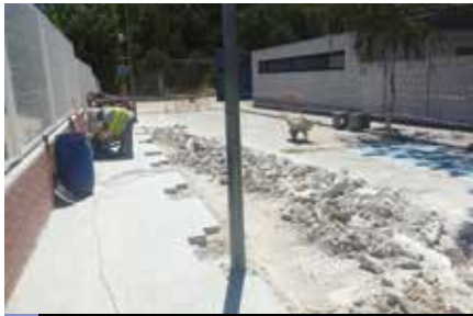
Treballs del Camí Escolar al carrer de Josep Aguilera