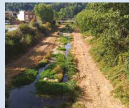
Un dels trams on es va realitzar la neteja de la llera del riu Anoia

la Llet fins al camp de futbol. Per tirar endavant aquesta actuació de manteniment, conservació i millora de la llera i l'entorn del riu Anoia, la Mancomunitat va signar un conveni d'encàrrec de gestió amb l'Agència Catalana de l'Aigua. L'actuació va consistir en un desbrossat selectiu amb màquina de fil a les zones amb arbustos, desbrossada de canya americana, poda de branques i tala d'alguns arbres morts.