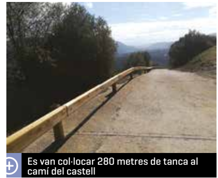
Es van col·locar 280 metres de tanca al camí del castell

Les barreres que es van instal·lar són de tipus bionda amb ànima metàl·lica i fusta exterior per a la seva integració dins de l'entorn natural per on passa el camí. Aquesta protecció es va fabricar seguint la normativa europea de seguretat.