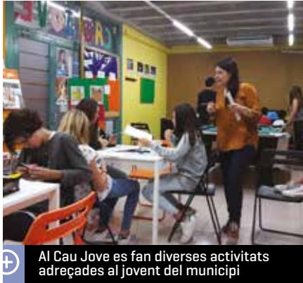
Al Cau Jove es fan diverses activitats adreçades al jovent del municipi