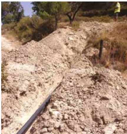
Obres per portar l'aigua als veïns de ca l'Isidret

Els veïns del barri de ca l'Isidret disposen, des de final d'estiu, d'aigua potable de la xarxa municipal. Fins aleshores s'abastien de la canonada del polígon de la Riera de Castellolí, de Vilanova del Camí, ja que es trobava més a prop. Les obres les va executar l'empresa Aigua de Rigat i van suposar una inversió de més de 35.000 euros. L'aigua prové de la xarxa del polígon dels Plans d'Arau, al final del carrer d'Alessandro Volta. Des d'aquest punt es va portar fins al mig del barri, on es va instal·lar un hidrant d'incendis, i en parteixen tres ramals: un per abastir la majoria