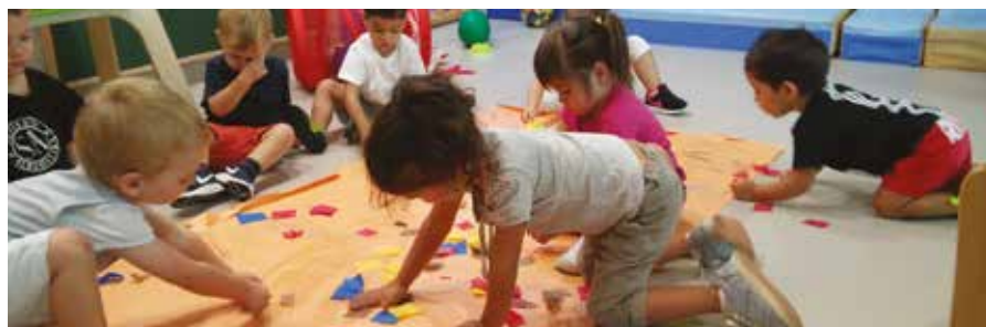
Nens i nenes de la llar d'infants municipal

A l'escola, les classes es van iniciar el 12 de setembre i s'estan portant a terme nous projectes. En aquest sentit, cal