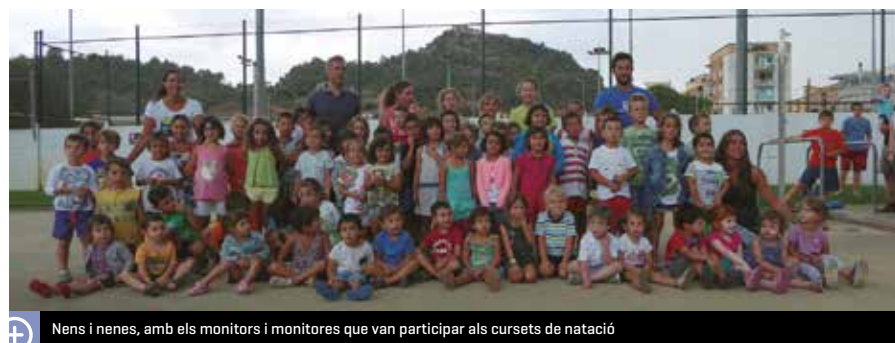
Nens i nenes, amb els monitors i monitores que van participar als cursets de natació

Una setantena de nens i nenes van participar, del 27 de juny al 22 de juliol,