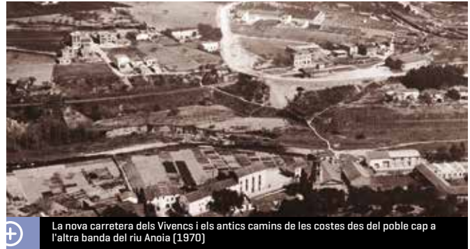
La nova carretera dels Vivencs i els antics camins de les costes des del poble cap a l'altra banda del riu Anoia [1970]

Entre les tramitacions i els treballs de les explanacions, la