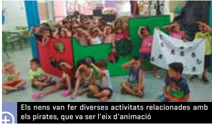
Els nens van fer diverses activitats relacionades amb els pirates, que va ser l'eix d'animació

Més de 140 nens i nenes van participar a l'Escola d'Estiu i al Casalet, organitzats per l'Ajuntament. A la primera activitat, que portava per nom "Fes esport, juga i diverteix-te", s'hi van inscriure més de 130 nens, d'entre 3 i 12 anys, i a la segona, una quinzena, d'entre 0 i 2 anys. L'Escola d'Estiu, organitzada per la regi-