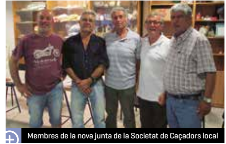
Membres de la nova junta de la Societat de Caçadors local

La temporada de caça és des de principi de setembre fins a final de març. Durant aquest període, els caçadors