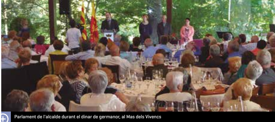
Parlament de l'alcalde durant el dinar de germanor, al Mas dels Vivencs

La dissetena edició de la Setmana de la Gent Gran, organitzada per la regidoria de Benestar Social, es va cloure, el diumenge 5 de juny, amb un dinar de germanor que va aplegar més de 220 poblatans. Des del dilluns 30 de maig i durant tota la setmana, les persones de la tercera edat van poder gaudir d'un ampli ventall d'activitats, com el Juguem Plegats, una excursió a Palafrugell i Platja d'Aro o un bingo.