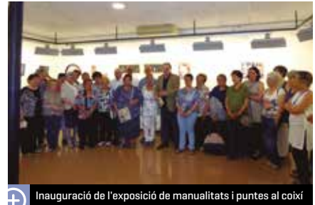
Inauguració de l'exposició de manualitats i puntes al coixí

peces elaborades de manera artesanal. Les conegudes fofuchas , joiers, làmpades, ampolles decorades convertides en un penjador o quadres confeccionats amb puntes de coixí, bé sigui un mocador o un vano, són alguns dels tresors que es van poder descobrir en aquesta col·lecció, organitzada per la regidoria de Cultura.