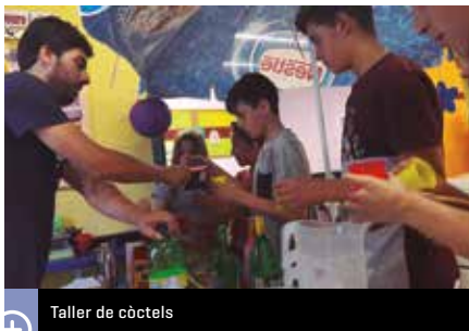
Taller de còctels

La regidoria de Joventut, a través del Cau Jove, ha organitzat el mes de juliol diverses propostes refrescants per al jovent del nostre municipi. Tallers sobre diverses temàtiques, una sessió de cinema a la fresca o una festa hippy són algunes de les activitats que s'han portat a terme.