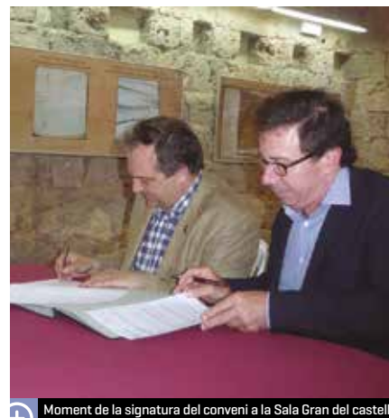
Moment de la signatura del conveni a la Sala Gran del castell