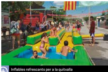
Inflables refrescants per a la quitxalla

peces elaborades de manera artesanal. Les conegudes fofuchas , joiers, làmpades, ampolles decorades convertides en un penjador o quadres confeccionats amb puntes de coixí, bé sigui un mocador o un vano, són alguns dels tresors que es van poder descobrir en aquesta col·lecció, organitzada per la regidoria de Cultura.