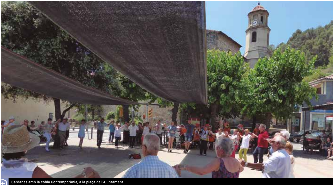
Sardanes amb la cobla Contemporània, a la plaça de l'Ajuntament