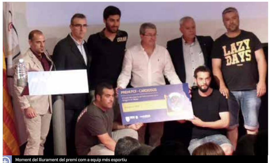
Moment del lliurament del premi com a equip més esportiu

Com a obsequi per a aquesta distinció el club va rebre un desfibril·lador. En la lliga 2015-2016, l'equip amateur va jugar dins de la quarta divisió i va quedar sisè, amb 58 punts. La classificació i els punts obtinguts per la resta d'equips del club aquesta temporada van ser: juvenil, novè, amb 24 punts; cadet A, setè, amb 48 punts, i cadet B, setzè, amb només un punt. Els tres equips van jugar dins de la segona divisió de cada categoria. Durant els mesos de juny i juliol, des de l'entitat esportiva s'han organitzat diverses activitats. El cap de setmana del 18 i 19 de juny més d'una cinquantena d'equips de diferents poblacions catalanes van participar en un torneig de futbol 7. Aquest campionat, que també es va fer el desembre, el va organitzar el