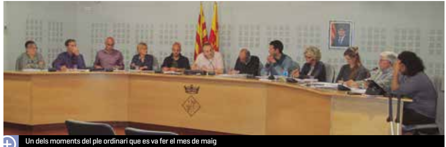
Un dels moments del ple ordinari que es va fer el mes de maig

Tal i com s'especifica, i com es va dir en la reunió informativa del 6 de maig, el tribut es merita a 1 de gener i, per tant, no existeix la possibilitat de modificar-lo amb efectes retroactius i retornar els diners als contribuents durant l'exercici 2016. Com