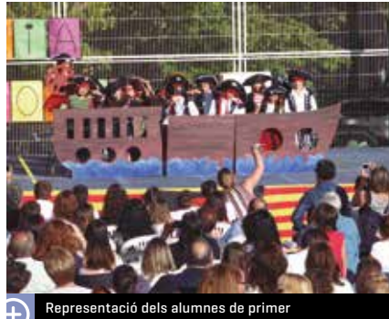
Representació dels alumnes de primer

Alumnes, professors i pares de l'escola Maria Borés van acomiadar, el dissabte 18 de juny, el curs 2015-2016. Una representació dels nens i nenes i un sopar, en què hi van participar unes 400 persones, van ser els actes més destacats d'aquesta festa, organitzada per l'escola i l'Associació de Mares i Pares d'Alumnes (AMPA) del centre, amb la col·laboració de l'Ajuntament. Tot i que a primera hora de la tarda el temps no era gaire segur, es van poder fer totes les activitats previstes al pati del centre. Cap a les 7 de la tarda, els 207 alumnes van oferir una actuació. Cada curs va interpretar una coreografia: "Els Barrufets, l'inspector Gadget, Heidi i un llop", educació infantil; "Un mar de pirates", primer; "El despertar de la granja", segon; "Superhéroes", tercer A; "De vacances", tercer B; "Paraules", quart; "Show talent", cinquè, i "Sax", sisè.