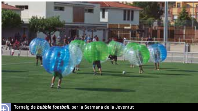
Torneig de bubble football , per la Setmana de la Joventut

Unes 150 persones van assistir, a la plaça dels Països Catalans, a aquesta activitat.