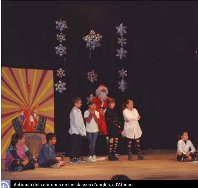
Actuació dels alumnes de les classes d'anglès, a l'Ateneu