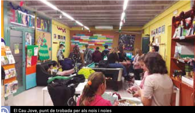
El Cau Jove, punt de trobada per als nois i noies