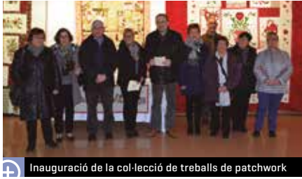
Inauguració de la col·lecció de treballs de patchwork