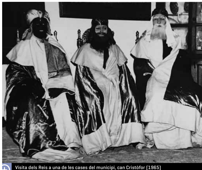
Visita dels Reis a una de les cases del municipi, can Cristòfor [1965]

Entre d'altres incidències, cal esmentar que el 1971, a causa