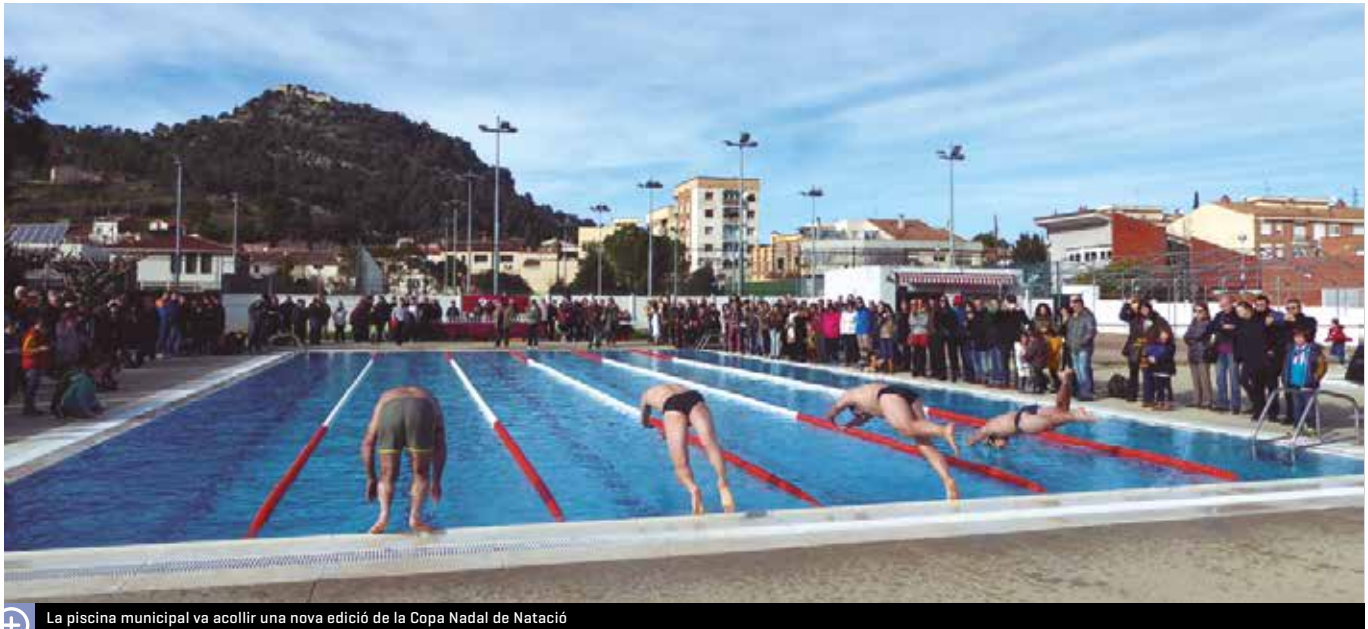
La piscina municipal va acollir una nova edició de la Copa Nadal de Natació