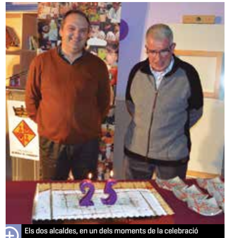
Els dos alcaldes, en un dels moments de la celebració