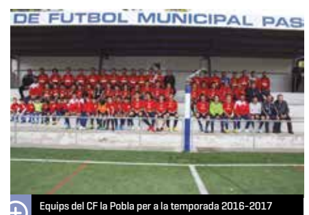
Equips del CF la Pobla per a la temporada 2016-2017