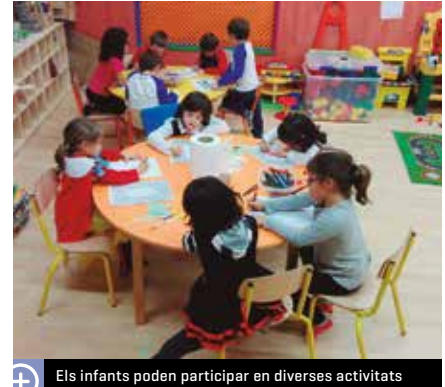
Els infants poden participar en diverses activitats

Els dies de la setmana que hi ha més nens inscrits són els dilluns, els dijous i els divendres. L'equipament estarà obert fins a final de juny. La regidoria d'Infància ja fa anys que ofereix aquest servei, que és de gran utilitat per a les famílies.