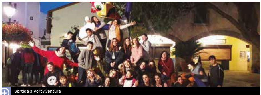
Sortida a Port Aventura

D'excursions se'n va fer dues: una, a Port Aventura amb motiu de Halloween, el diu-