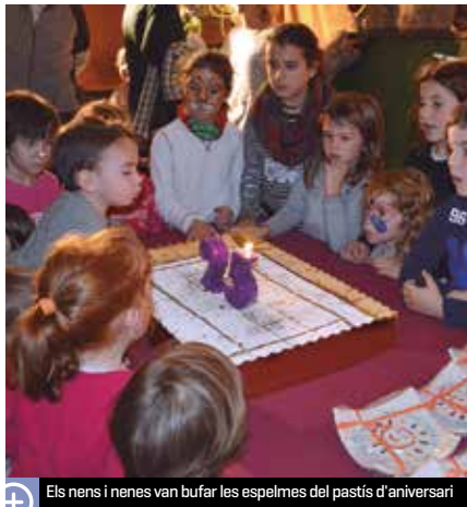
Els nens i nenes van bufar les espelmes del pastís d'aniversari