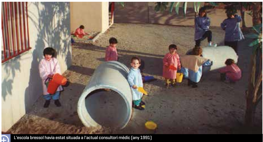
L'escola bressol havia estat situada a l'actual consultori mèdic (any 1991)

de maquillatge, un de fer un arbre amb empremtes i un altre de confeccionar un imant per a la nevera amb el logo del Sol Solet. I com a cloenda de la festa, la companyia Galiot-Teatre de Titelles va oferir l'espectacle "Palla, fusta, pedra", basat en el conte dels Tres porquets , i que va fer passar una estona divertida als més petits.